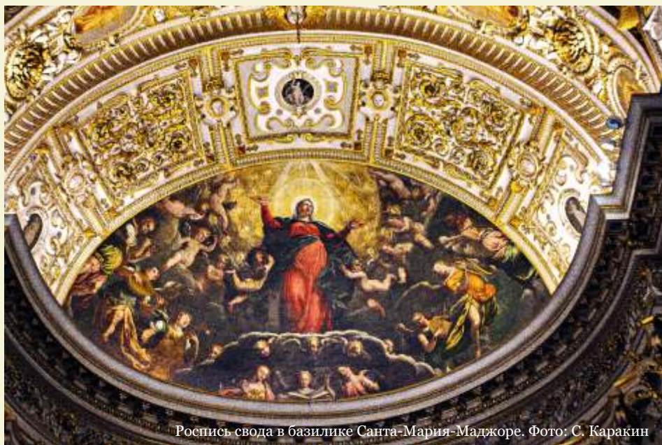
Роспись свода в базилике Санта-Мария-Маджоре.

шие музеи. Туристы сыты, руины целы и все сохранено для потомков.