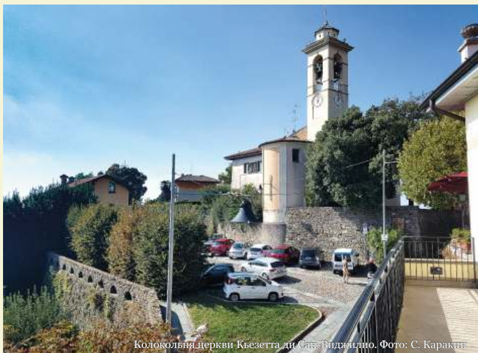
Колокольня церкви Кьезетта ди Сан-Виджилио.