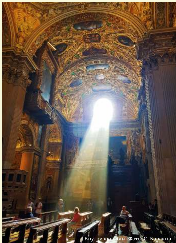
Внутри капеллы.