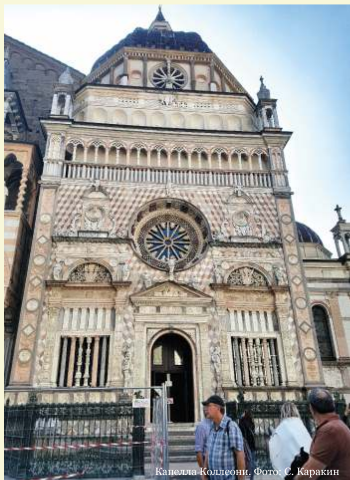
Капелла Коллеони.

Мы – я, жена, две наши девочки – оказались в аэропорту в 10 утра, где нас должен был встречать человек, у которого мы взяли напрокат авто на целый день. Так как планов было – громадьё и посмотреть мы собирались много чего, я решил, что, толь-