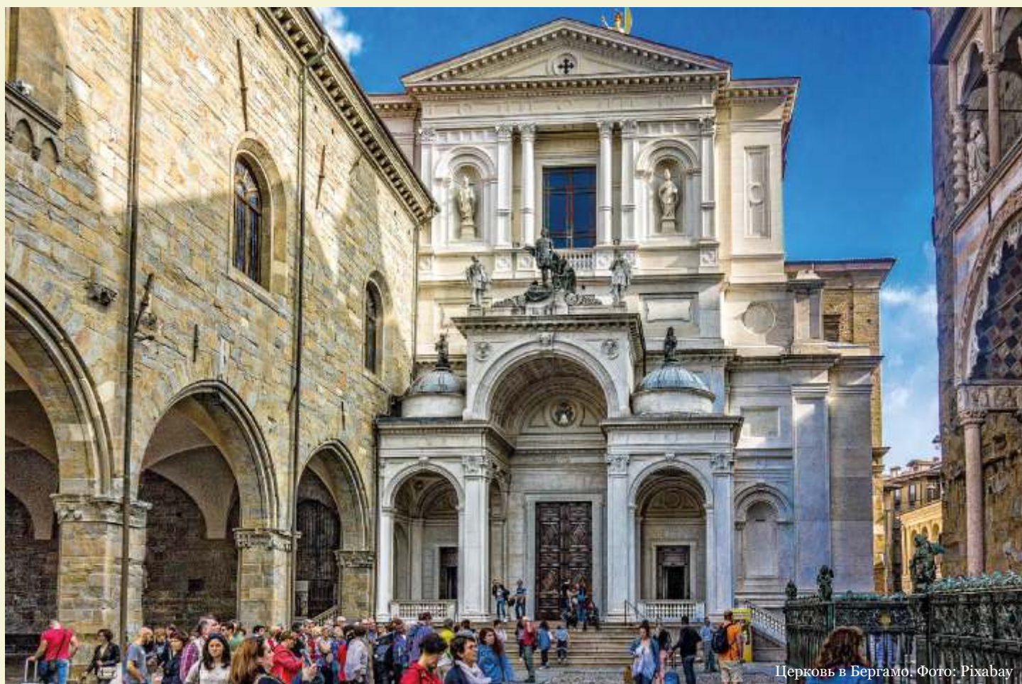
Церковь в Бергамо.

Услышали еще одну интересную историю от гида. Гид показала нам ресторан, буквально находящийся в руинах. Оказалось, что при постройке ресторана строители наткнулись на очередной культурный слой с имеющими большую историческую ценность артефактами. Стройку моментально заморозили и начали искать выход из этого сложного положения. И выход был найден! Интерьером этого ресторана как раз и стали эти самые археологические раскопки, конечно, после того как самое ценное было перемещено в ближай-