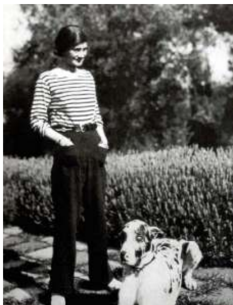
Коко Шанель в 1928 году

После войны, получив от знакомых сведения, что фабрика национализирована, а в стране правят коммунисты, Эрнест эмигрировал во Францию. В возрасте 36-ти лет ему пришлось начать жизнь с нуля. Он прие-