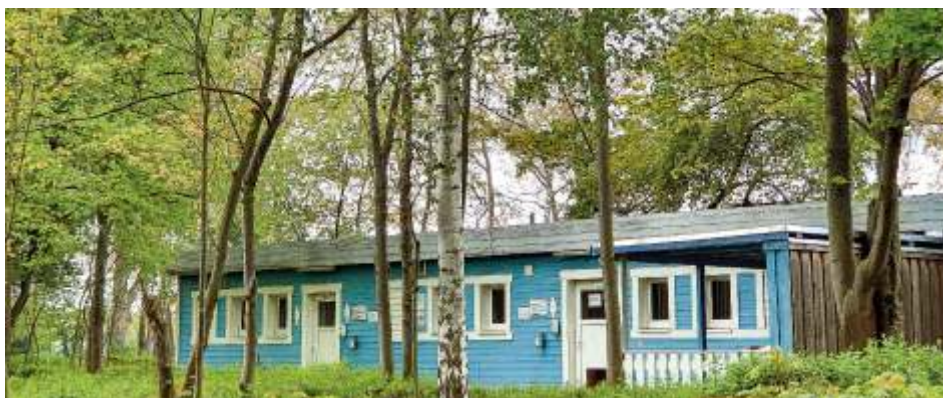
Санитарная зона в кемпинге на Кульквитцер зее