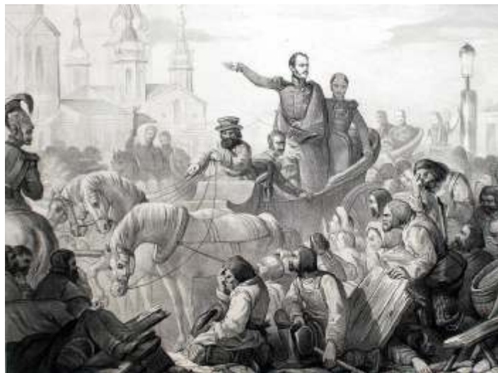
Николай I усмиряет толпу на Сенной площади во время холерного бунта

сквы князя Дмитрия Владимировича Голицына на время карантина издавалась газета «Ведомости о состоянии города Москвы», в которой содержалась информация о числе заболевших, умерших, выздоровевших, давались необходимые советы, пресекались вымыслы и слухи. Газета выходила под редакцией профессора московского университета Михаила Петровича Погодина и распространялась бесплатно. К середине ноября холерой заболели 4500 москвичей, 2340 из них умерли.