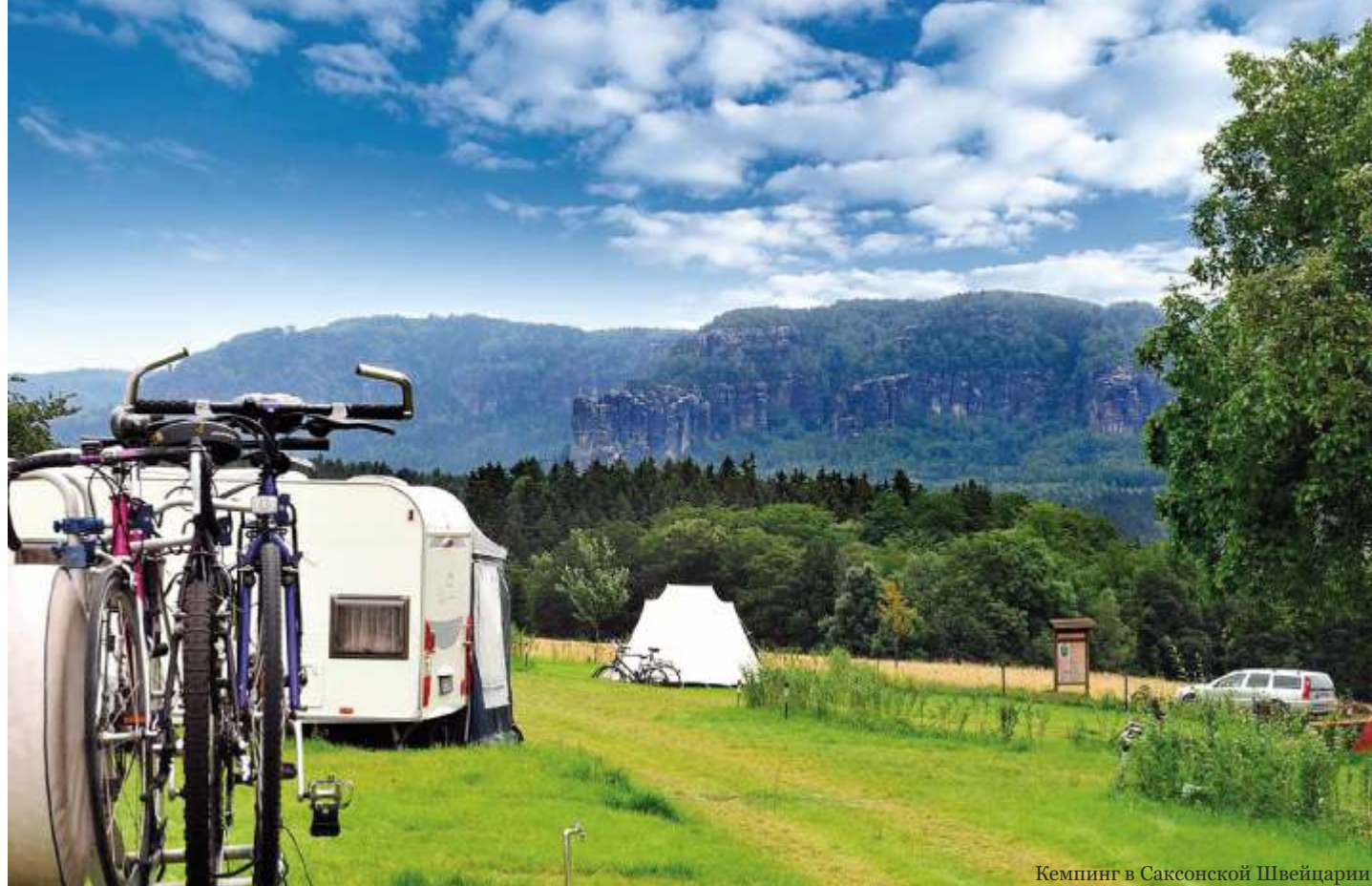
Кемпинг в Саксонской Швейцарии