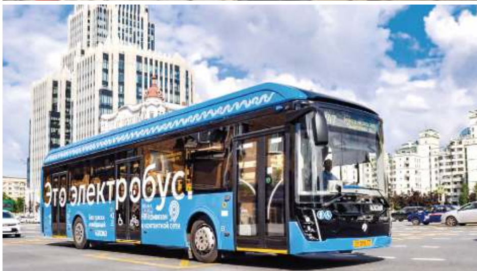
По Москве в данный момент ездят 656 электробусов