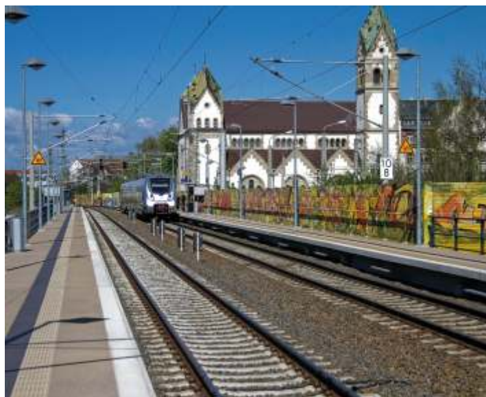
Вокзал в наши дни

Ущерб, нанесенный станции Плагвиц во время Второй мировой войны, был незначительный. Более серьезный урон инфраструктура понесла