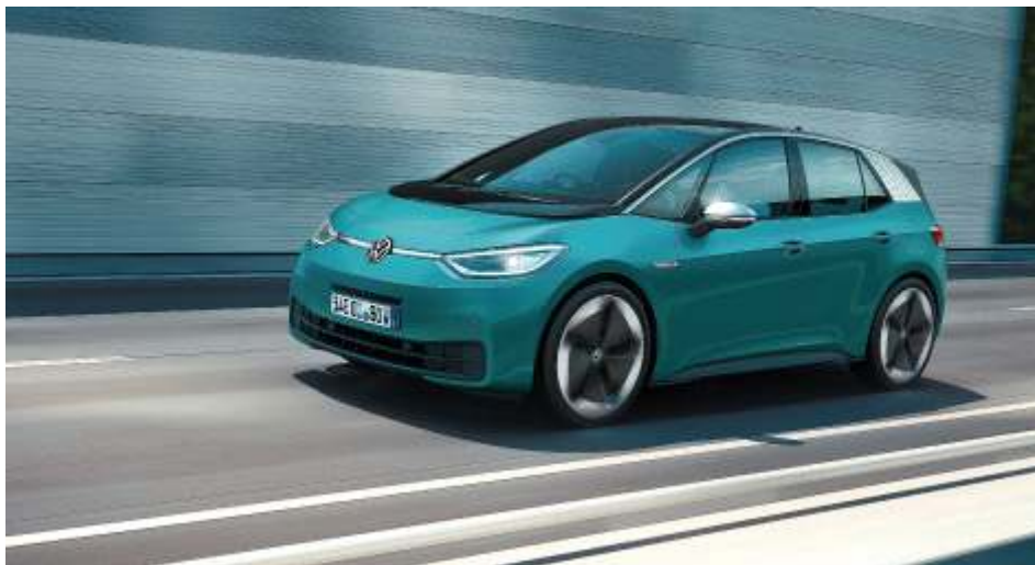
Популярный автомобиль Volkswagen ID.3 производится в Саксонии