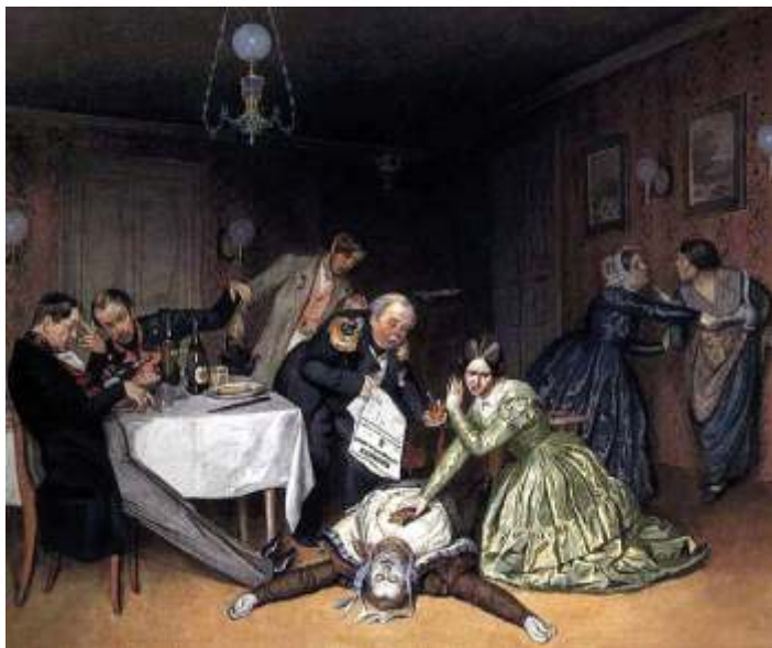
«Всё холера виновата», худ. П. А. Федотов, 1848 г.

По распоряжению военного генерал-губернатора Мо-