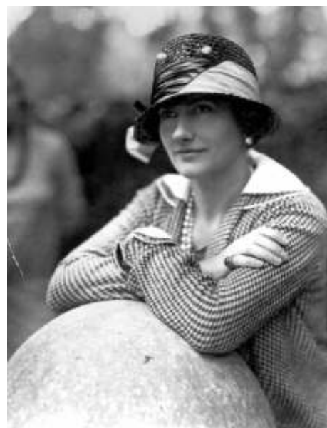
Коко Шанель в Париже, 1929 г.