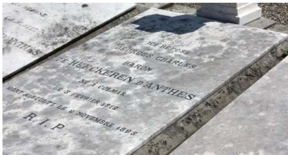
Могила барона Жоржа Геккерна (Дантеса)