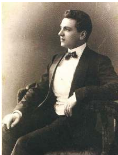
Портрет Эрнеста Бо (1917/1921 гг.)