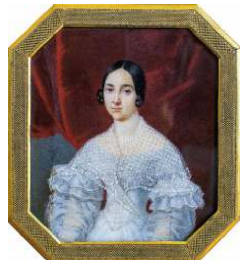
Баронесса Екатерина Геккерн, урожденная Гончарова (Париж, 1838 г.)