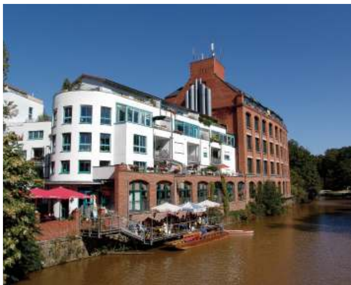
Канал имени Карла Гейне – излюбленное место горожан и туристов

железных дорог станция Плагвиц к 1899 году превратилась в крупнейший грузовой пункт Лейпцига.