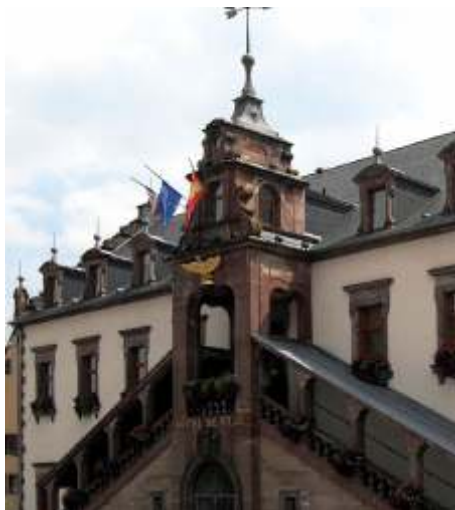
Здание ратуши в Сульсе