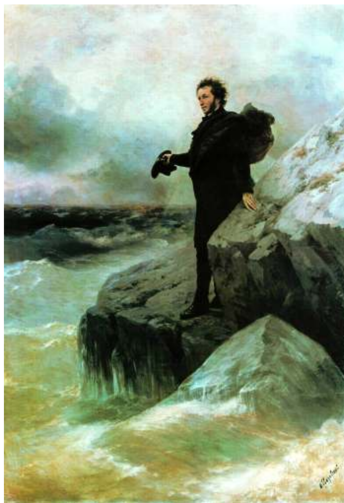
Перед отъездом из Одессы. «Прощание Пушкина с морем», худ. И. К. Айвазовский, И. Е. Репин, 1877 г.

Смертельная и крайне опасная болезнь пришла в Россию из Азии и объяснялась возвращением русской армии с Востока после войны с персами и турками. Летом 1830 года