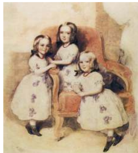
Дети Дантеса — Леони, Матильда и Берта Геккерны, акварель Леопольда Фишера, 1843 г.