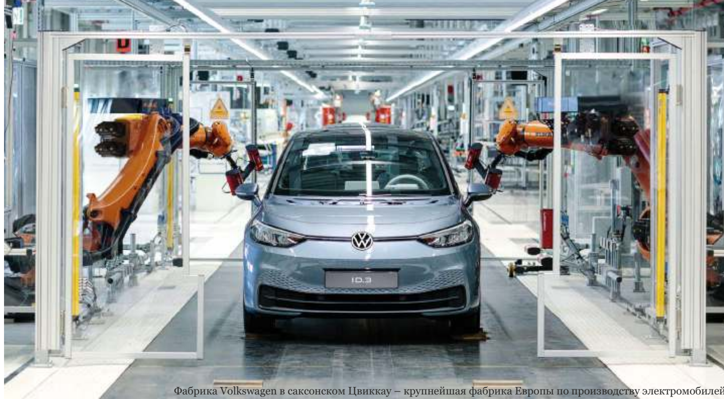
Фабрика Volkswagen в саксонском Цвиккау – крупнейшая фабрика Европы по производству электромобилей