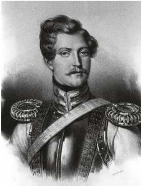
Барон Жорж Шарль Дантес. Литография с портрета работы неизвестного художника (октябрь 1830 г.)

«...Как говорится, все течет, Любая память есть почет, И потому на кой нам черт Гадать, каким он был?.. Да нам плевать, каким он был, Какую музыку любил, Какого сорта кофий пил... Он Пушкина убил!»