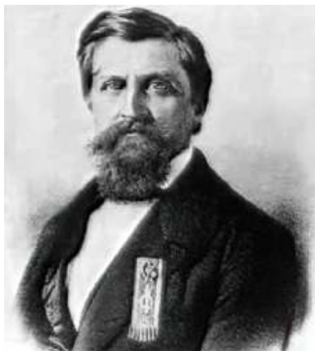
Барон Жорж Шарль де Геккерн (Дантес) — мэр Сульсы, 1855 г.

Между тем Жорж де Геккерн-Дантес делал блестящую карьеру, прило-