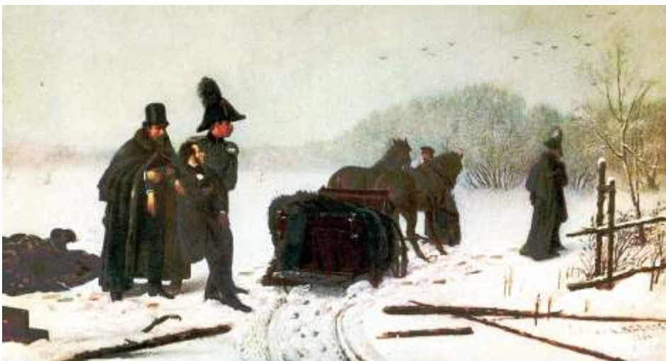
Дуэль Пушкина с Дантесом, худ. А. Наумов, 1884 г.

В этом ключе примечательно письмо, написанное спустя несколько дней после дуэли приемным отцом Дантеса, бароном де Геккерном барону Верстолку: «Очень может быть, что несколько дней будет достаточно, чтобы утишить это волнение, тем более что оно не выразилось ни разу угрожающим образом; одним словом, это просто взрыв чувства и гордости народной, затронутой личностью поэта, самого популярного в России. В то время как честь литератора охранялась почитателями, честь част-