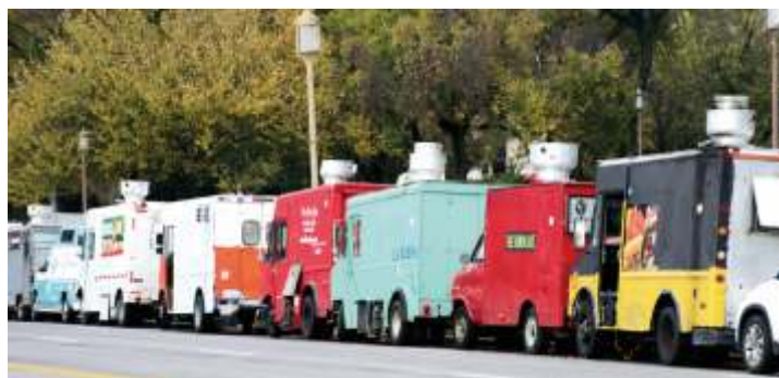
Фургоны с фастфудом во время выборов