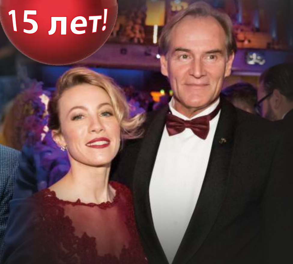
Обербургомистр Бурхард Юнг с супругой на оперном балу в Лейпциге