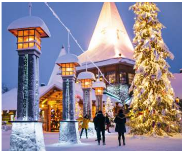
Посетители пересекают Полярный круг

Карина Томсинская Фото: visitrovaniemi.kuvat.fi