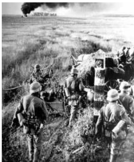
Войска вермахта пересекают государственную границу Советского Союза 22 июня 1941 года

тия сети не существовало. Это объясняет, почему японцам достаточно легко и быстро удалось выявить всю агентуру, включая Зорге.