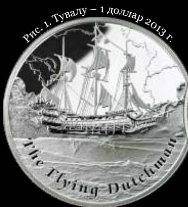
Рис. 1. Тувалу — 1 доллар 2013 г.

В вагнеровской версии «Летучего голландца», ставшей популярной благодаря музыкальному гению композитора, проклятый капитан раз в семь лет имеет право причали-