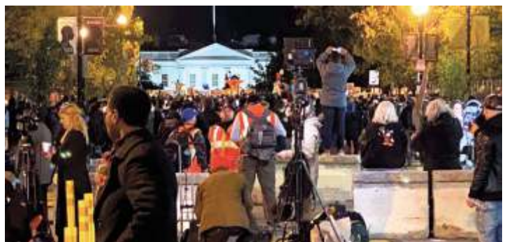
Демонстрация возле Белого дома