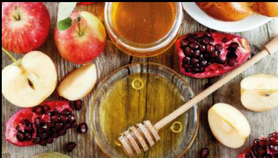
Праздничный стол в Израиле