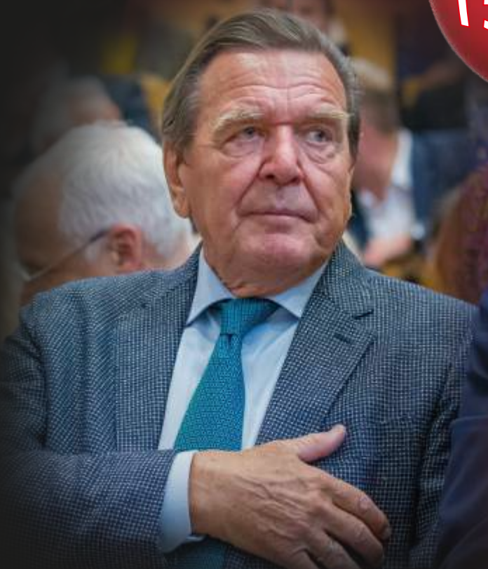
Выступление Герхарда Шрёдера в Высшей школе менеджмента в Лейпциге