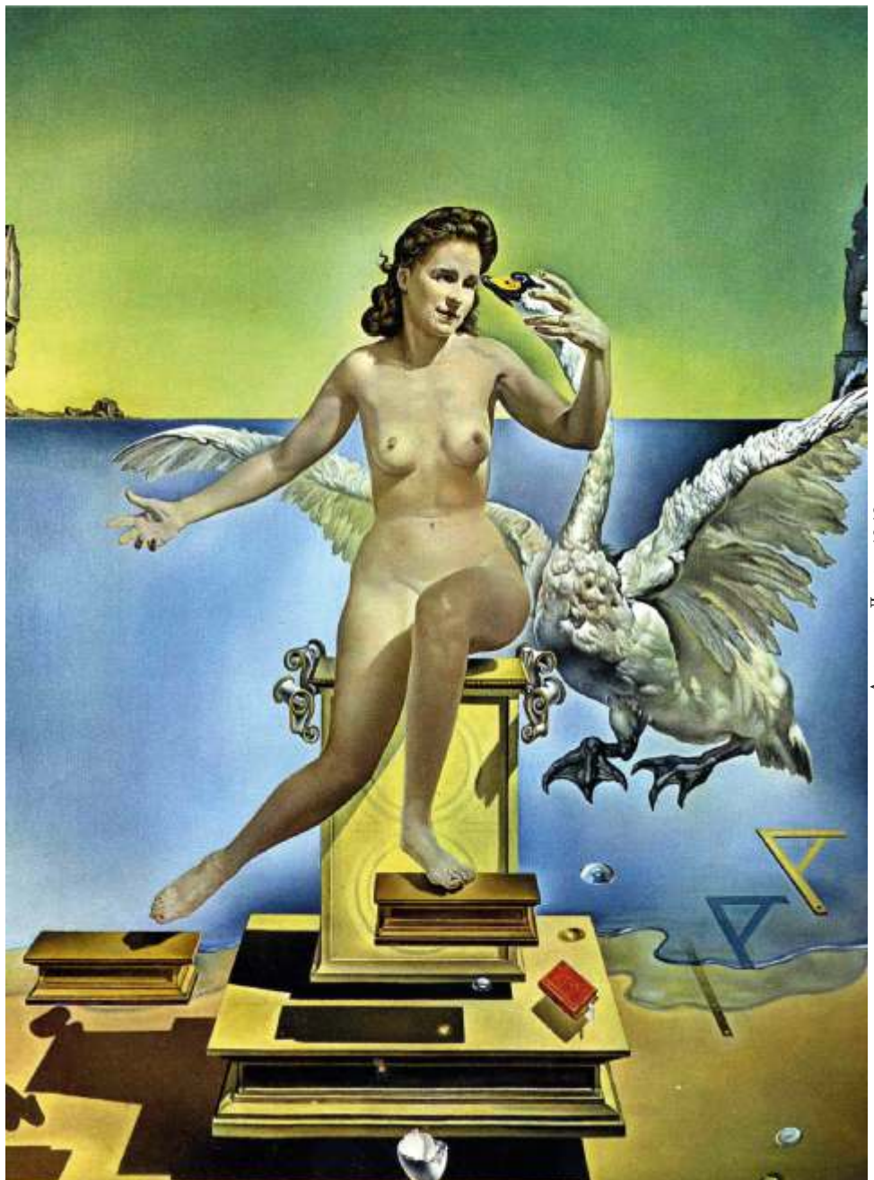
«Атомная Леда», 1949 г.