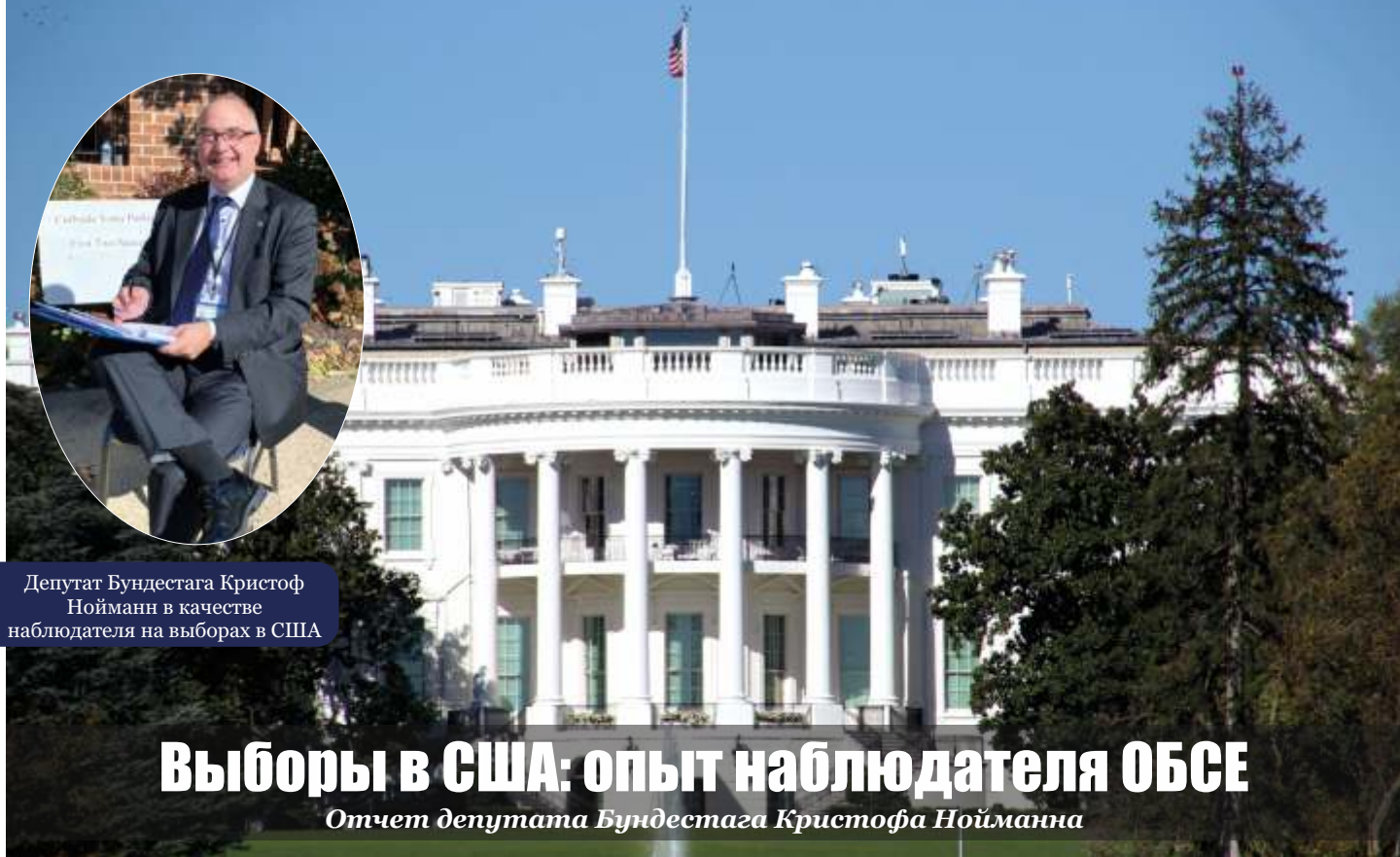
Депутат Бундестага Кристоф Нойманн в качестве наблюдателя на выборах в США