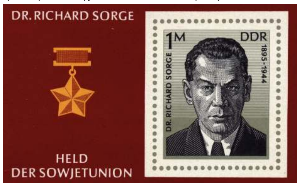
Почтовая марка ГДР с изображением Рихарда Зорге

Источники: В. М. Чунихин: «Рихард Зорге – заметки на полях легенды»; Е. Н. Кульков: «Германия и Япония: единство и противоречия накануне Второй мировой войны»; журнал «Наука, общество, оборона»: «Тройственный пакт 1940 г.»; litresp.ru: «Тюремные записки Рихарда Зорге».