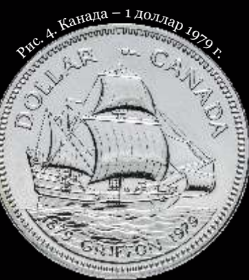
Рис. 4. Канада — 1 доллар 1979 г.