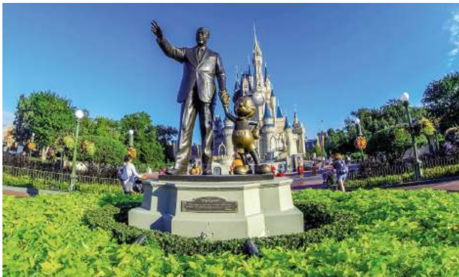
Памятник «Партнеры» (Уолт Дисней с Микки Маусом) в старейшем Диснейленде мира в Орландо, Флорида