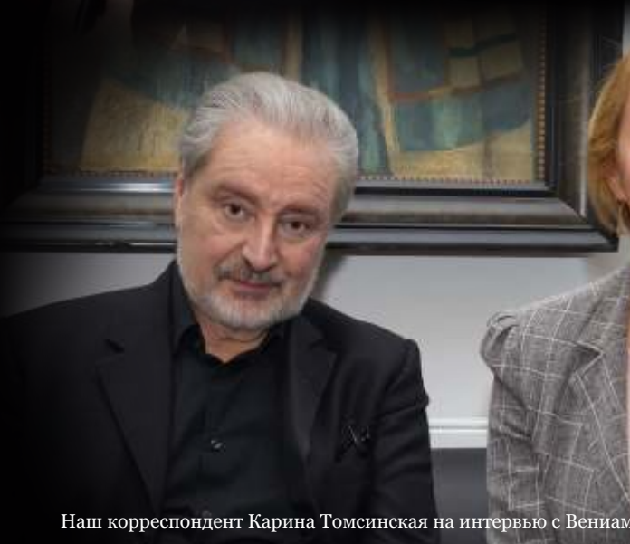
Наш корреспондент Карина Томсинская на интервью с Вениамином Смеховым, 2019 г.