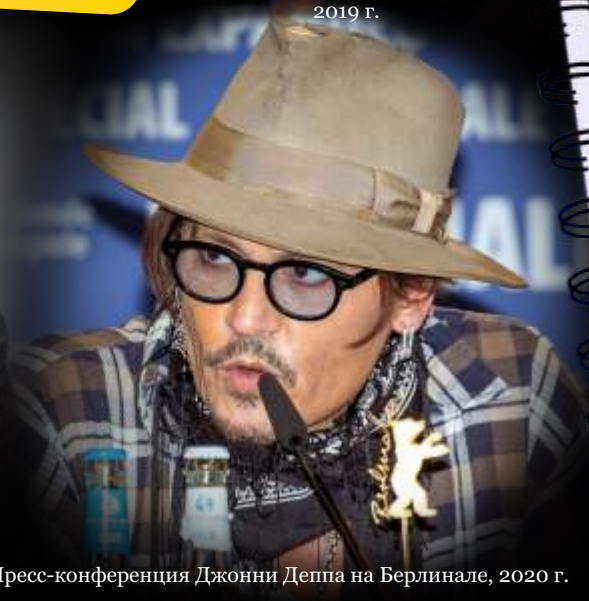
Пресс-конференция Джонни Деппа на Берлинале, 2020 г.