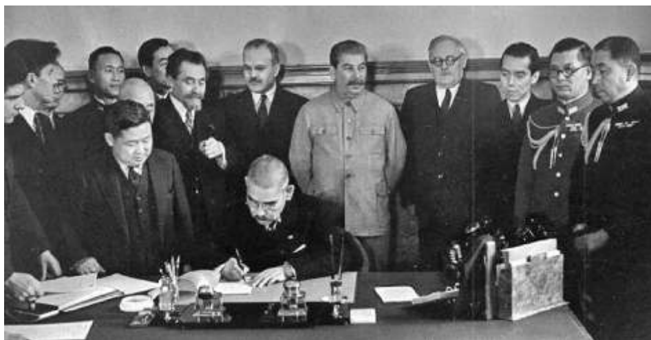
Подписание пакта о нейтралитете между СССР и Японией

18 декабря 1940 года Гитлер подписал указ №21 о подготовке плана «Барбаросса» – сценария нападения на Советский Союз. Определив свое внешнее стратегическое направление, Германия пыталась добиться поддержки Японии в войне против СССР. Из-за болезни Клаузена Зорге удалось отправить в Москву тревожное предупреждение о военных пла-