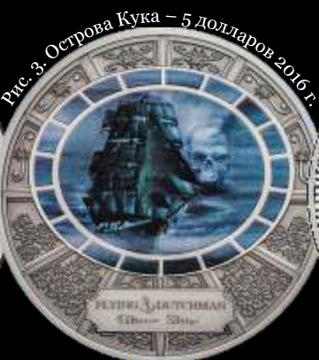
Рис. 3. Острова Кука — 5 долларов 2016 г.