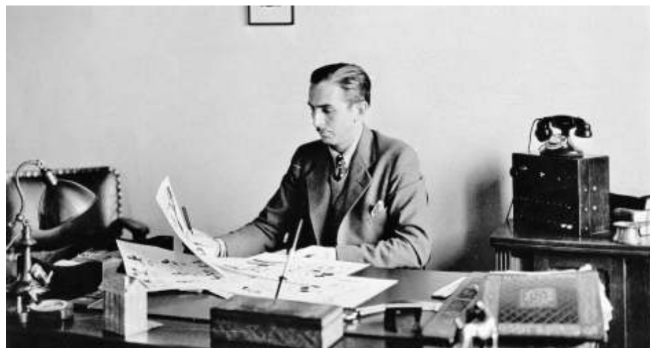
Уолт Дисней за работой.

Затем он вернулся в Америку и поступил в Чикагский институт искусств. В 1923 году с 40 долларами в кармане он отправился в Голливуд. Вместе с братом, который уехал в Голливуд раньше, он открыл маленькую анимационную студию и создал нового персонажа – мышонка Микки Мауса. В 1928 братья выпустили первый в истории анимационный фильм со звуком. Фильм стал сенсацией, а Микки Маус приобрел огромную популярность. Хотя сам Уолт всю жизнь боялся мышей, именно Микки стал его ключом к успеху.