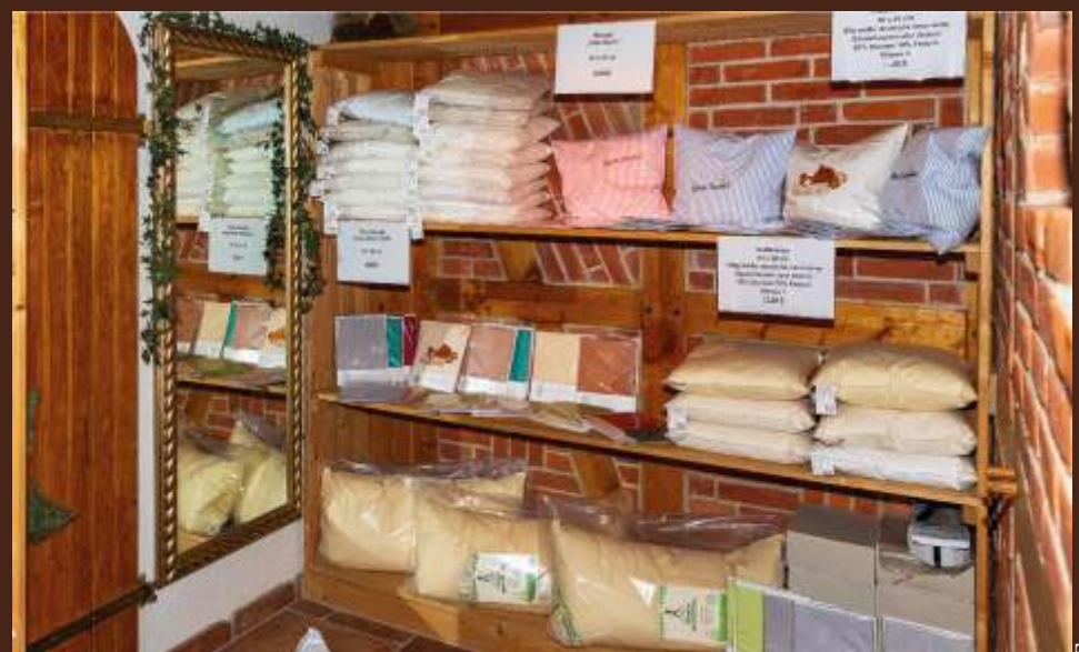
Гусиное перо и пух высоко ценятся на мировом рынке