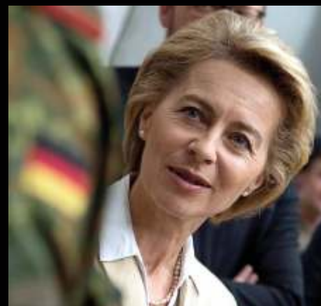
Урсула фон дер Ляйен. Председатель Европейской комиссии, бывшая министр обороны ФРГ

«Время не проходит, как она, в конце концов, стала думать, а снова и снова возвращается, словно движется по кругу. Но и на этот раз Урсула не пала духом. Она отчитала Хосе Аркадио Второго, будто малого ребенка, заставила его умыться, побрить бороду и потребовала помочь ей довершить восстановление дома».