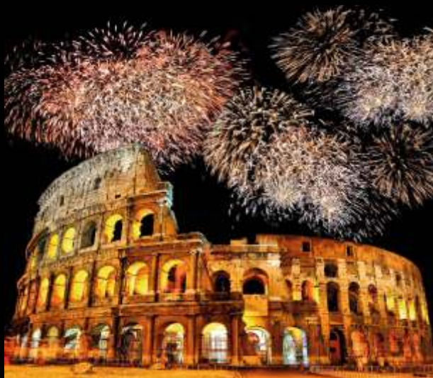
Новогодний салют в Италии

Заглянем в Израиль: там Новый год отмечается в сентябре, он называется Рош ха-Шана, что в переводе означа-