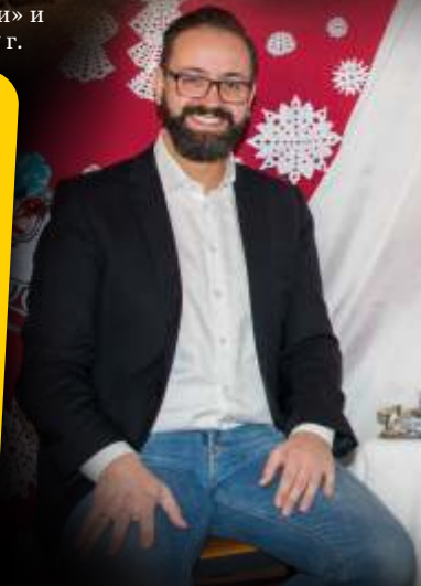
Интервью в помещении «Моста»