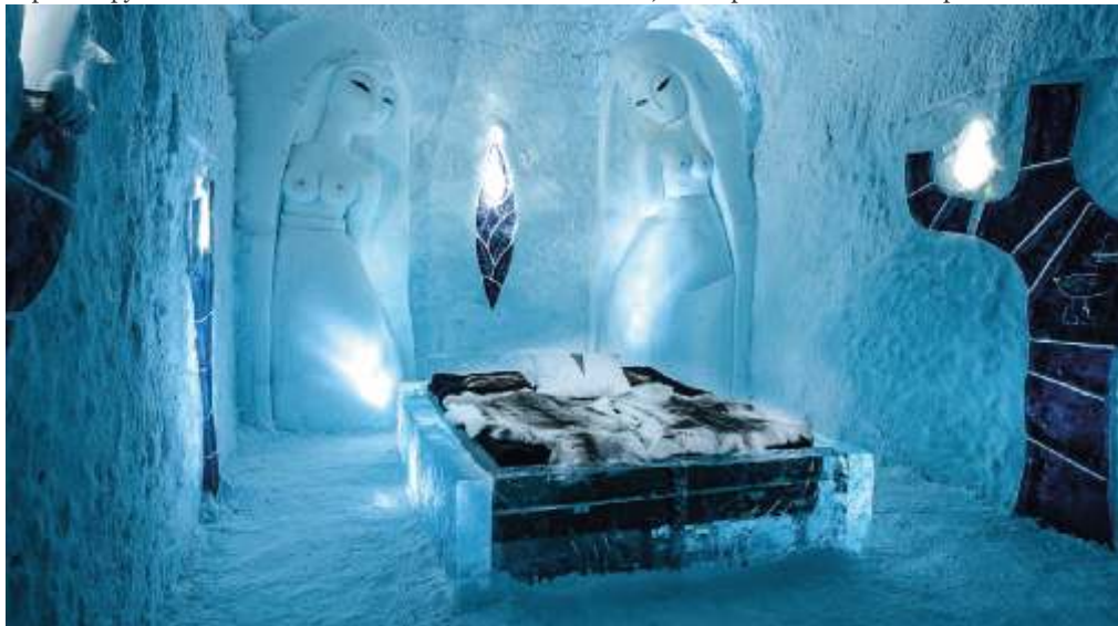
Застеленная шкурами кровать в ледяном отеле