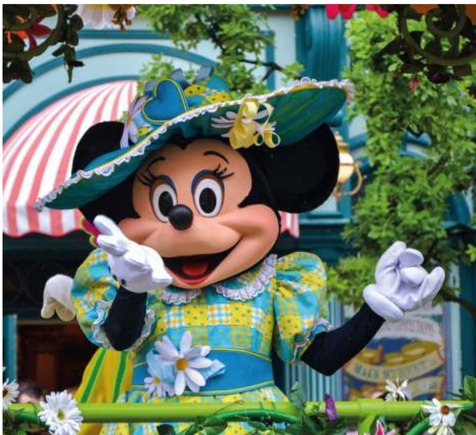
Минни Маус – возлюбленная Микки Мауса