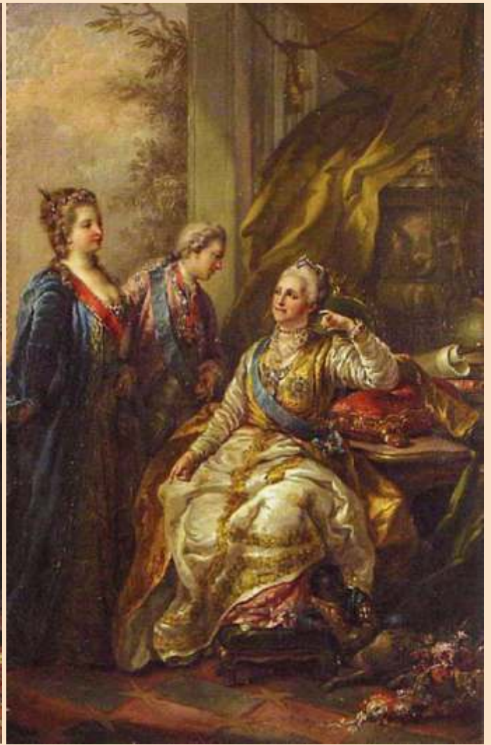
«Великий князь Павел Петрович представляет императрице Екатерине II свою невесту, будущую великую княгиню Марию Федоровну». Худ. С. Торелли, 1776 г.

талья Алексеевна при поддержке Разумовского готовит государственный переворот. Молодая женщина, воспитанная в Европе в свободном духе, начала проявлять властность и непокорность, склоняла к самостоятельности и мужа.