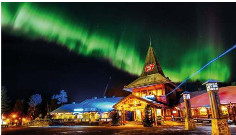
Рождественский дом Санта-Клауса в Рованиemi

Санта работает каждый день, без праздников и выходных. Он принимает огромное количество гостей из разных стран мира, ведь он разговаривает на всех языках. В этой же деревушке есть почта, куда Санте приходят письма с просьбами и пожеланиями из разных уголков мира. Ни одно письмо не остается без ответа.