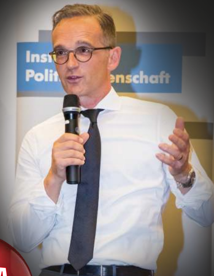
Встреча с Хайко Маасом в Лейпциге