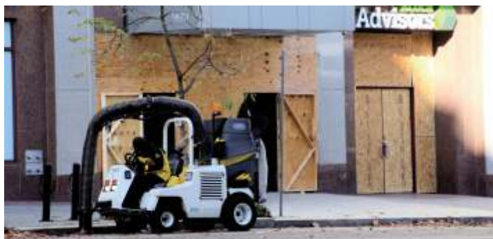
Заколоченные на время выборов магазины

Касательно голосования по почте мы получили следующую информацию от директора Почтовой службы США: в 42-х штатах, а также в городе Вашингтоне существует законное право голосования по почте в течение срока, начинающегося за 45 дней до дня выборов. В среднем избиратели голосуют по почте примерно за 19 дней до фактического дня выборов. В семи штатах (Коннектикут, Кентукки, Миссисипи, Миссури, Нью-Гэмпшир, Южная Каролина, Делавэр) права на голосование по почте нет, допускается только личное голосование. Это объясняется тем, что в XIX веке каждый человек, имеющий право голоса, должен был присутствовать на месте, чтобы предотвратить фальсификацию выборов. Тогда это был современный и широко распространенный метод.