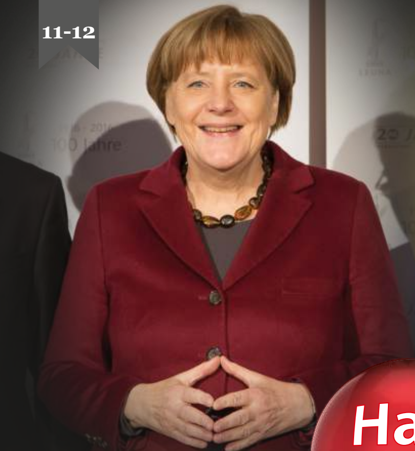
Ангела Меркель на торжественном приеме в Лойне

15 лет – прекрасный возраст читайте на стр. 9-11