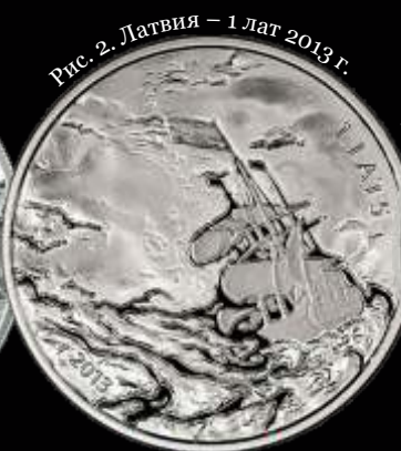
Рис. 2. Латвия — 1 лат 2013 г.