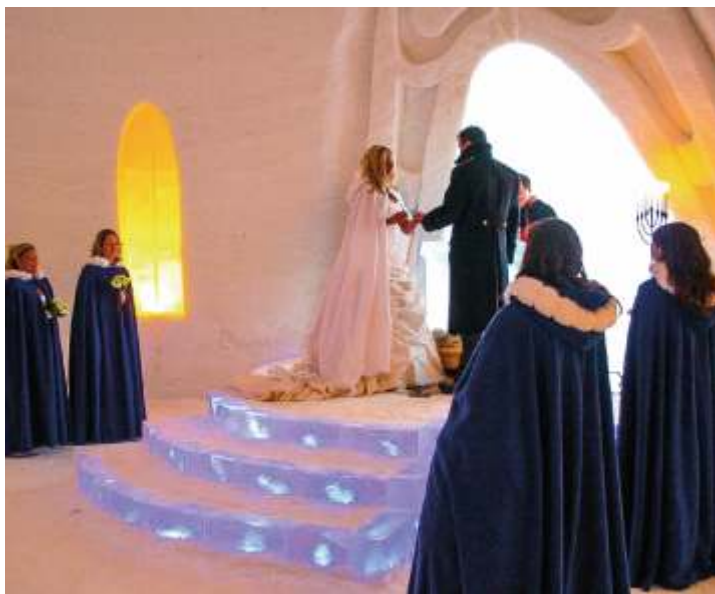
Снежная часовня, в которой заключаются браки