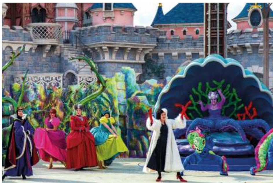
Сказочные персонажи в парижском Диснейленде