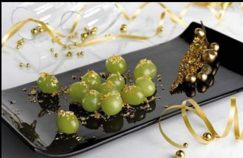
12 виноградин в Испании