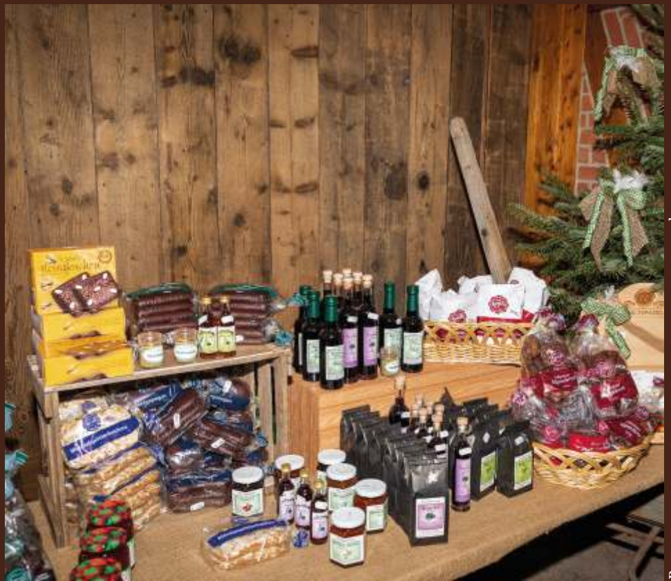
В магазине при ресторане можно купить продукты фермерского производства

Есть при ферме и уютный ресторанчик, где по традиции шеф-повар готовит рождественских гусей. В связи с пандемией коронавируса ресторан закрыт, но гуся от шефа можно взять с собой в одноразовой посуде. Мы заглянули на кухню, где творит шеф-повар, и поинтересовались у него, чем же полезно гусиное мясо. Оказывается, оно является источником белков и витаминов группы А, В и Е, а также богато минеральными веществами – калием, фосфором, магнием, железом и цинком. А гусиный жир издавна используется для лечения ревматизма и заживления ран.