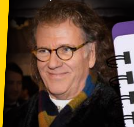
Андре Рё на оперном балу в Дрездене, 2019 г.