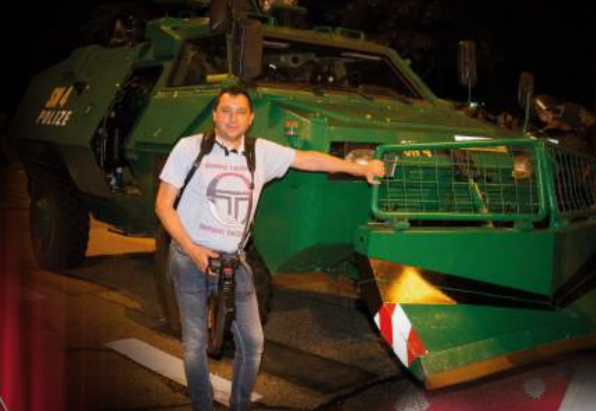
Встреча «большой двадцатки» и беспорядки в Гамбурге, 2017 г.