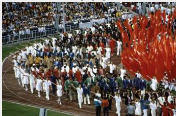
Церемония закрытия XXII Летних Олимпийских игр

Источники: Süddeutsche Zeitung ; www.dpa-news.de