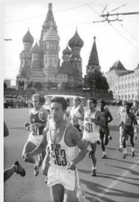
Марафон 1 августа в центре Москвы

40 стран последовали призыву Штатов игнорировать Олимпиаду-80, за медали в Москве боролись только 80 стран. Многие африканские, южноамериканские и азиатские страны отказались по другим причинам.