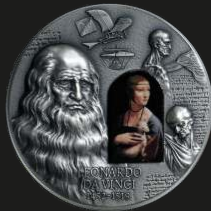
Рис. 5. Камерун – 2000 франков 2019 г.