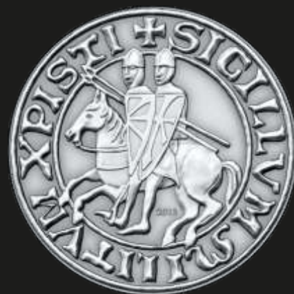
Рис. 6. Палау – 1 доллар 2013 г. (печать великих магистров ордена тамплиеров)