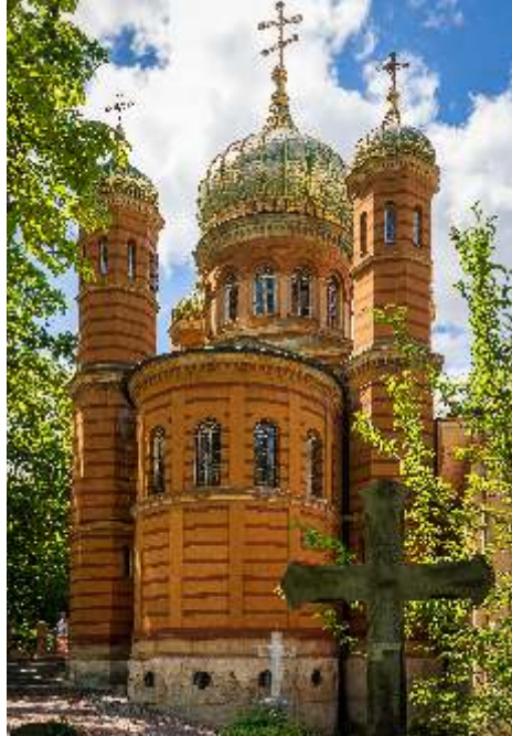
Русская православная церковь

Как интересно распорядилась судьба: Мария Павловна словно отзеркалила жизненный путь своей бабки Екатерины II. Та приехала в Россию из маленького немецкого городка Цербст и очень многое сделала для страны. А внучка, наоборот, приехала из большой страны в небольшое веймарское герцогство и все свои силы, энергию и