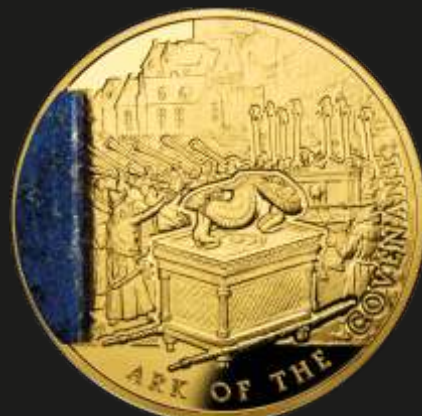
Рис. 3. Ниуэ – 100 долларов 2013 г. (золото, 40 мм, тираж 150 шт.)