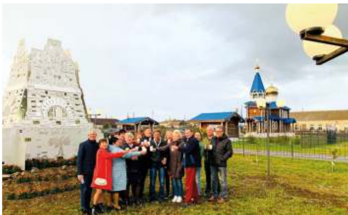
Встреча с жителями села Лейпциг (2019 г.)