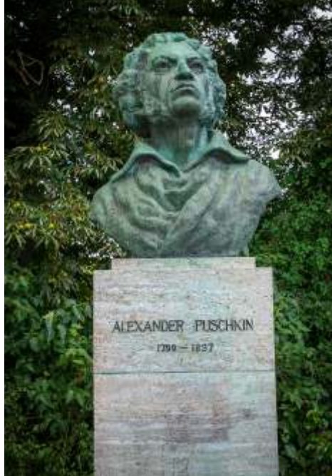
Бюст Александра Пушкина

возрасте 73-х лет в своем дворце Бельведере, на шесть лет пережив своего мужа. Она хотела, чтобы после ее смерти над могилой была сооружена русская православная часовня. Воля княжны была исполнена ее сыном Карлом Александром. Поскольку Мария Павловна принадлежала к русской царской семье и православной вере, по закону она должна была быть предана земле в России. Но она также была и герцогиней Саксен-Веймар-Айзенахской, поэтому ее и похоронили в Веймаре, в усыпальнице Веймарских герцогов, рядом с супругом, но на ее могилу из Санкт-Петербурга было доставлено несколько вагонов русской земли. Там же, в герцогской усыпальнице, похоронены Гёте и Шиллер.