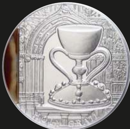
Рис. 2. Ниуэ – 2 доллара 2013 г. (серия «Тайны истории», серебро, вставка из агата, 50 мм, тираж 1500 шт.)