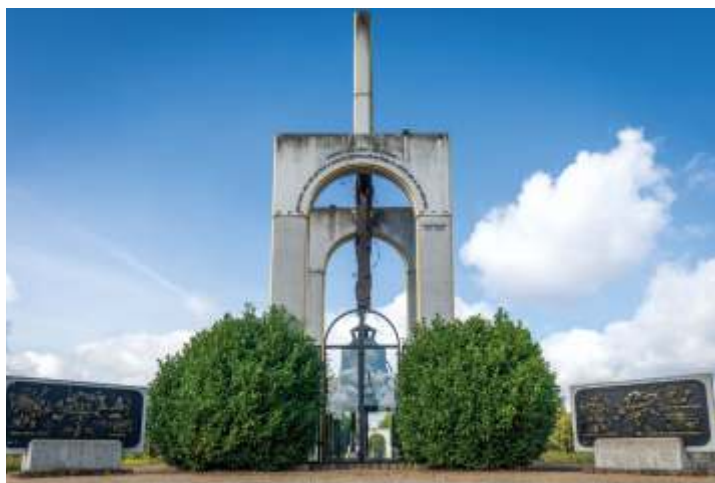
Европейский колокол Свободы