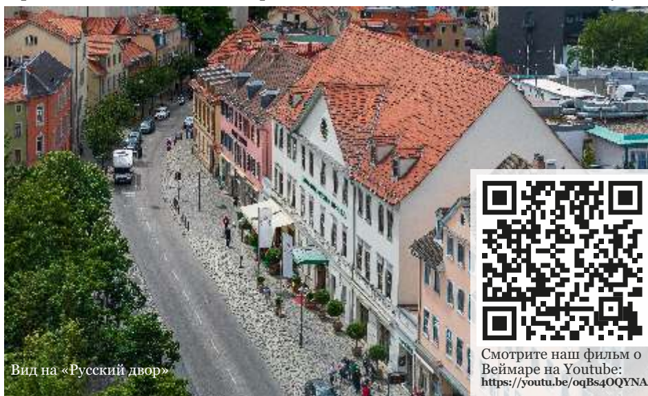
Вид на «Русский двор»