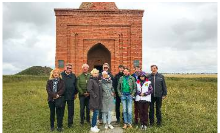
Посещение мавзолея Кесене (2019 г.)