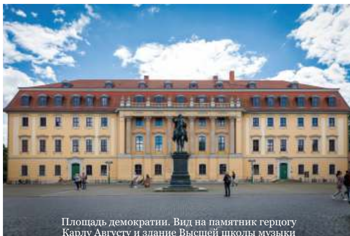
Площадь демократии. Вид на памятник герцогу Карлу Августу и здание Высшей школы музыки