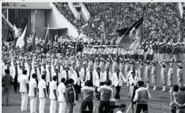
Сборная ГДР на Центральном стадионе