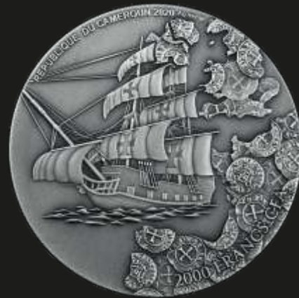
Рис. 7. Камерун – 2000 франков 2020 г. (аверс)