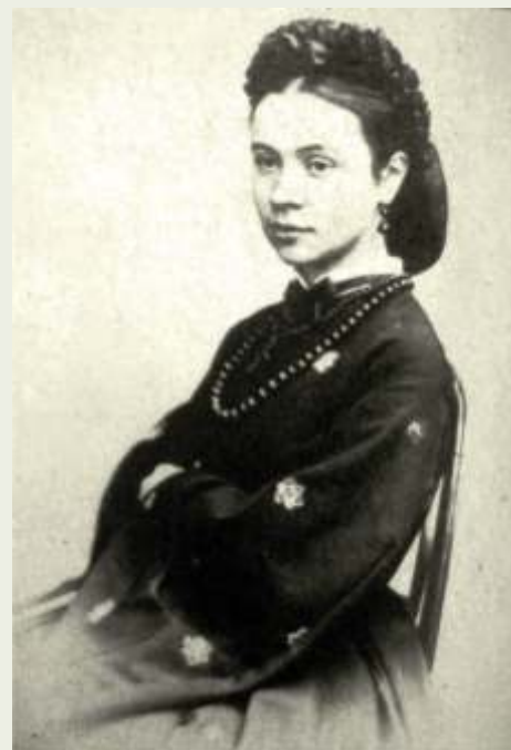
Ольга Смирнитская (1837–1920)

Модный композитор поначалу был желанным гостем в доме Смирнитских. В июле 1859 года Штраус официально попросил руки Ольги, но получил отказ от ее родителей. По их мнению, брак дворянки и капельмейстера, даже всемирно известно-