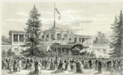
Павловский музыкальный вокзал