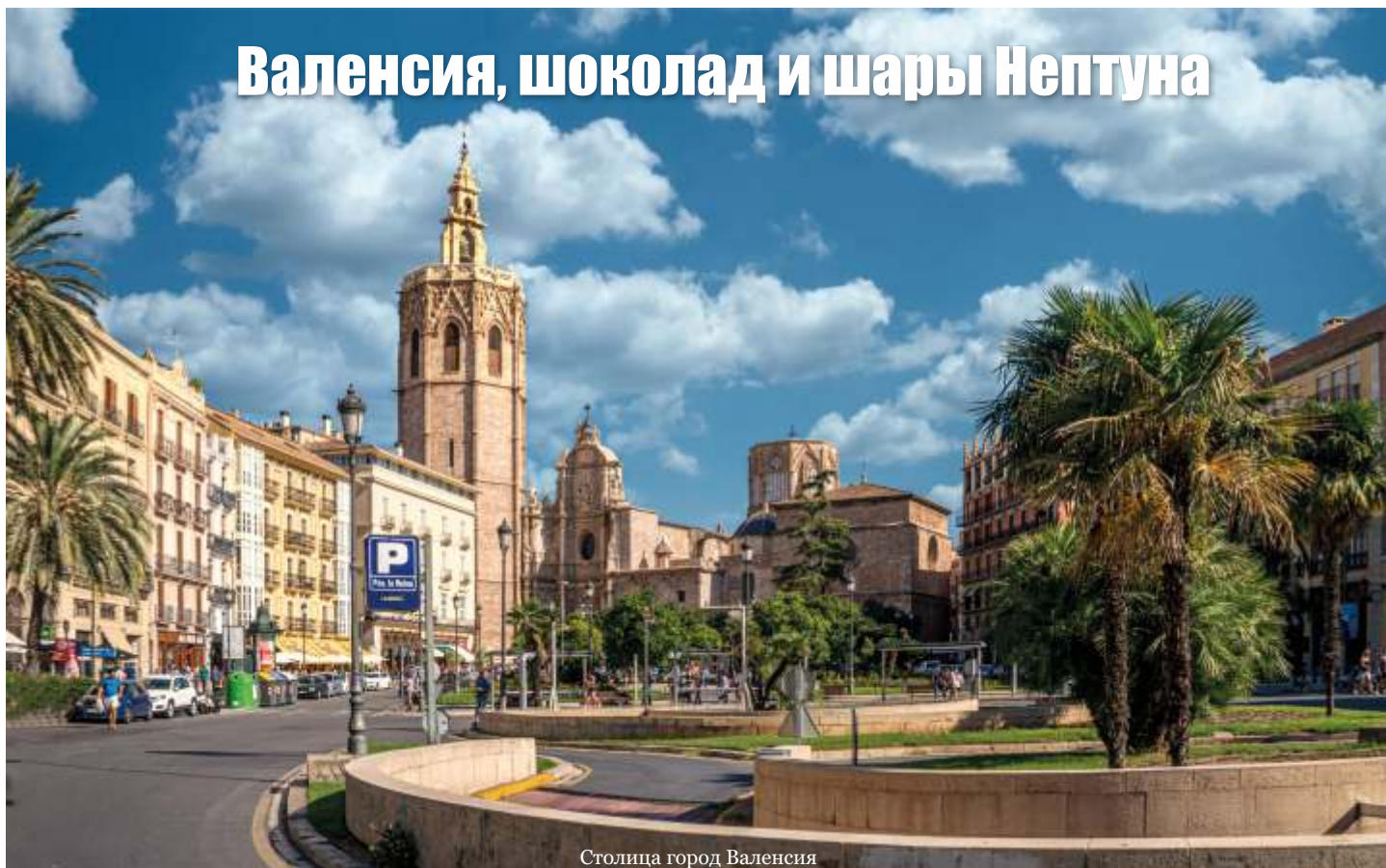
Столица город Валенсия

Валенсия, автономная область Испании, с одноименной столицей расположена в восточной части Пиренейского полуострова. На севере она граничит с Каталонией, на северо-западе – с Арагоном, ее восточные и юго-восточные земли омываются Средиземным морем. Там находятся курортные городки с великолепными морскими пляжами. Провинция все еще остается в тени своей гордой и претенциозной соседки Каталонии. Здесь не так много туристов. Большинство из них приезжают из континентальных районов Испании, при-