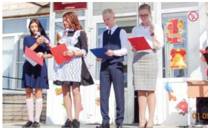
Поздравления от старшеклассников