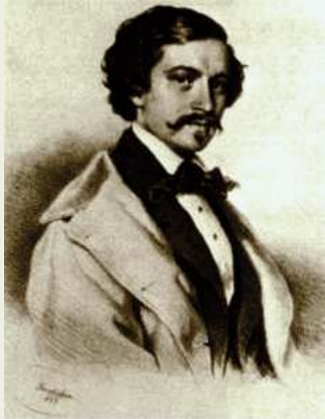
Иоганн Штраус в молодости