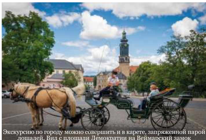
Экскурсию по городу можно совершить и в карете, запряженной парой лошадей. Вид с площади Демократии на Веймарский замок