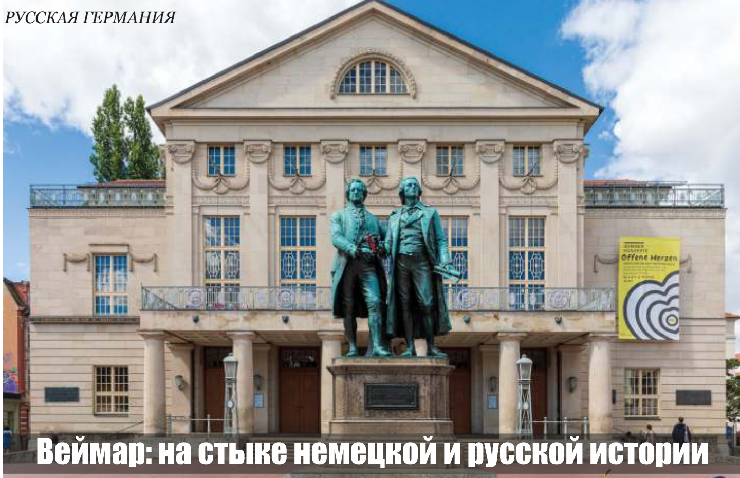
Театральная площадь Веймара. Памятник Гёте и Шиллеру (Гёте слева, Шиллер справа)