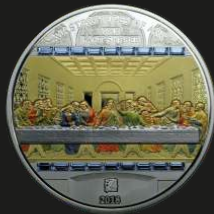
Рис. 4. Острова Кука – 45 долларов 2018 г. (украшена кристаллами Сваровски)