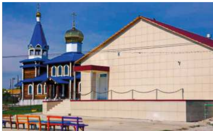
Отремонтированный дом культуры

В уральском Лейпциге ожидается знаковое для культурной жизни событие. После серьезного ремонта начинается работу Дом культуры. Построена новая сцена, сделаны новые полы, кровля на крыше, стены, современные коммуникации (подведена вода) и будет оборудован экраном для просмотра фильмов. Кроме того, в октябре зрительный зал уком-