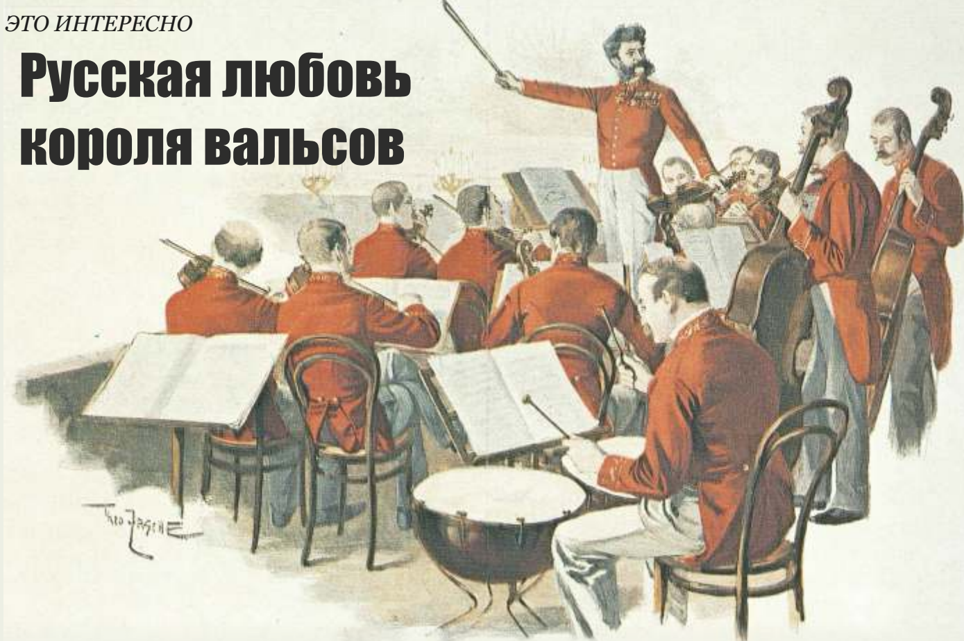
Йоганн Штраус руководит оркестром, худ. Тео Цаше

Король венского вальса – так называют великого композитора Йоганна Штрауса-младшего. Он написал 168 вальсов, которые были популярны в его время и любимы многими и в наши дни. Жизнь его была похожа на увлекательный роман. Он был очень влюбчив и пользовался успехом у женщин. Но по-настоящему полюбил он только одну – русскую девушку Ольгу.