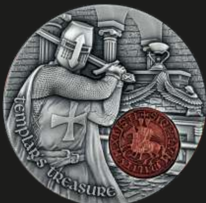
Рис. 1. Камерун – 2000 франков 2020 г. (50 мм, реверс)

Кстати, на тему «Тайной вечери» уже было выпущено несколько редких и изумительно красивых коллекционных дензнаков. Самым уникальным из них является монета из серии «Шедевры мирового искусства», состоящая в действительности из двух разных монет – серебряной с номиналом в 20 и золотой в 25 долларов. Одна накладывается на другую, и вуаля – перед нами почти точная копия знаменитой фрески Леонардо да Винчи (1495–1498), которая украшает главную церковь доминиканского монастыря в Милане Санта Мария делле Грации. Цветная вставка из золота с Иисусом и его учениками является той самой второй монетой с собствен-