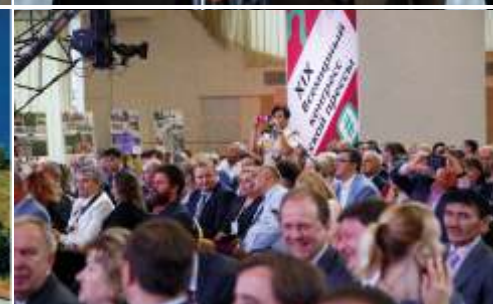
На конгрессе в Минске