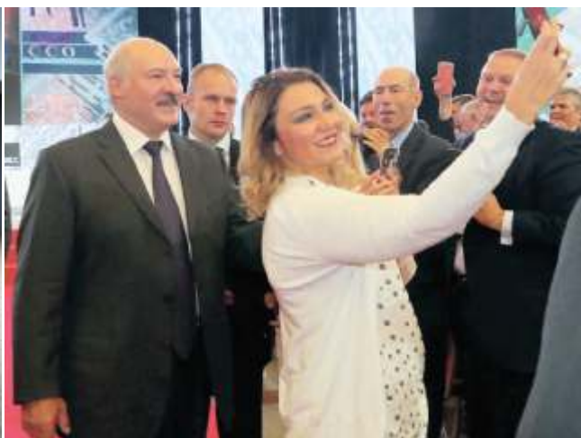
Нармина Агаси с президентом

Выступление президента Беларуси Александра Лукашенко на конгрессе русской прессы. Для просмотра сосканируйте QR-код с помощью Вашего мобильного телефона