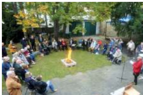
Цветаевский костер в Дрездене