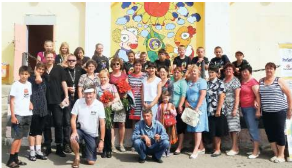
Рядом с домом культуры в Лейпциге на Урале