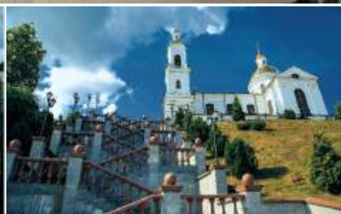
Свято-Успенский собор в Витебске