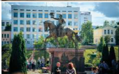
Памятник князю Ольгерду в Витебске