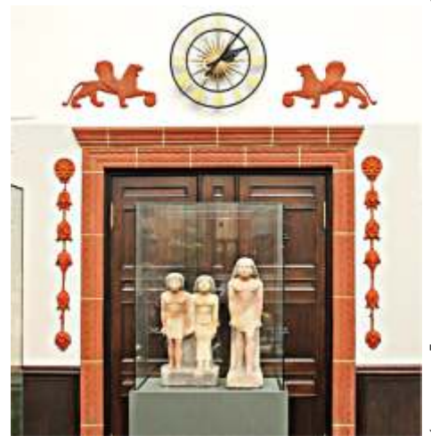
Кроххауз. Деталь интерьера