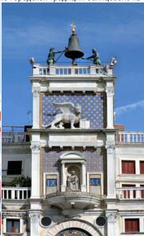
Венеция. Часовая Башня. Деталь