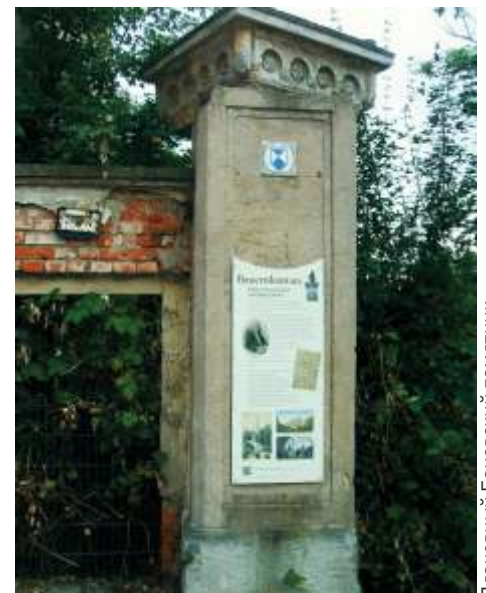
Плачевный Баховский памятник