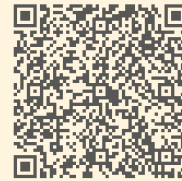
Michelson Pflegeambulanz GmbH