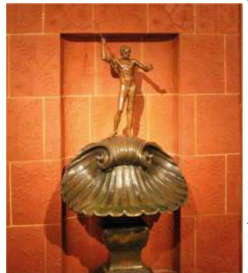
Кроххауз. Фонтан Нептуна