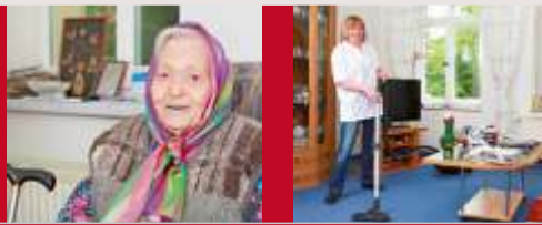
Наша цель – Ваше прекрасное самочувствие!

Die Pflegeambulanz für häusliche Gesundheitsversorgung Ищем медицинский персонал. Выплачиваем подьёмные!