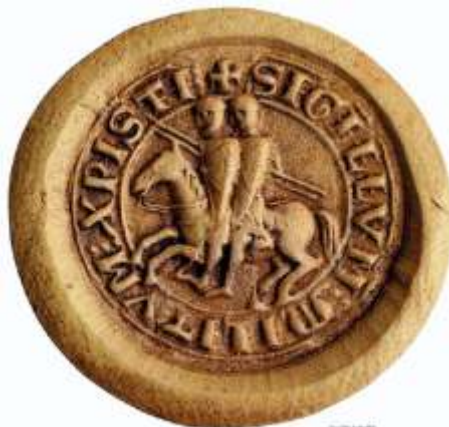
Аверс печати тамплиеров. Два всадника на одной лошади символизируют двойную природу храмовника — монаха и рыцаря, призванных защищать Святую Землю. Оригинал хранится в Национальном архиве Франции.

расчётах и погашениях старых и новых долгов. И в отстранении надоевшего ростовщика Западной Европы. Это тоже имело место. Главное, всё же, таится в осознании той удивительной и пока ещё не совсем осмысленной для нас, исключительной роли, которую сыграл этот Орден в истории человечества за свою не столь большую, но бурную и познавательную жизнь. Попробуем выстроить цепь доказательств.