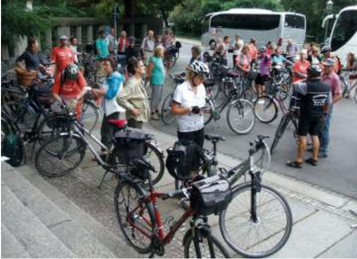
«Нотный след» перед стартом