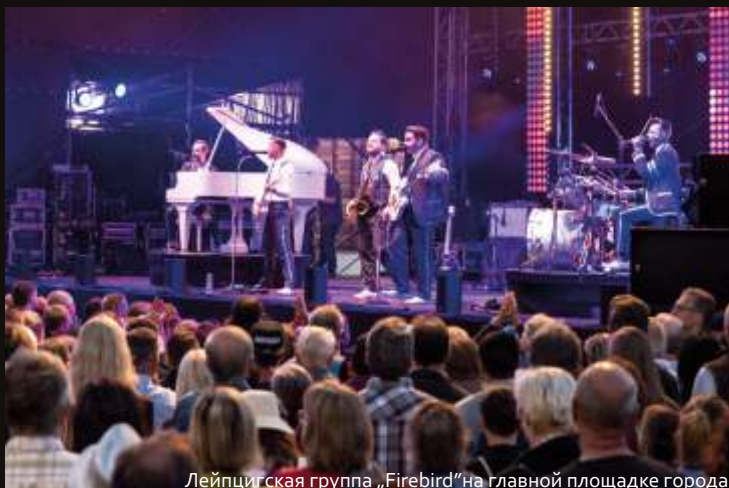
Лейпцигская группа „Firebird“ на главной площадке города

Лариса Целевич, Лейпциг