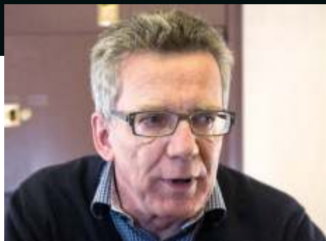
Глава МВД Германии Томас де Мезьер

В среду, 24 августа, правительство Германии приняло на шумевшую концепцию гражданской обороны. О каких угрозах в ней говорится и как власти намерены с ними бороться, объясняет DW.