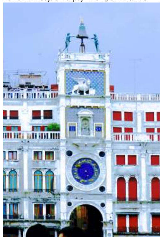
Венеция. Часовая Башня

Скульптурная группа установлена на своего рода пьедестал с латинской надписью: „OMNIA VINCIT LABOR“ (Труд всё преодолевает) – переиначенная цитата из Вергилия: „OMNIA VINCIT AMOR“ (Любовь всё преодолевает).