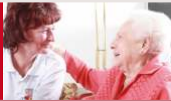
Патронажная служба по уходу