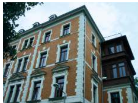
Дом Регера и Фаллдорфа

Поскольку те дома, где жила семья композитора в Лейпциге, не сохранились (их адреса: Felixstraße 4 , Kaiser-Wilhelm-Str. 68 ), мы отправились к дому на Schwendendorfstr. 61 , где Регер останавливался у своего друга, виолончелиста Гевандхауса-