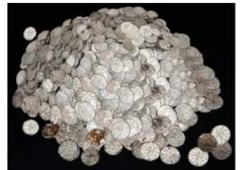
Клад из 708 серебряных денег, найденный в 1998 г. в поместье первого магистра ордена тамплиеров Гуго де Пайенса.

По данным зарубежной печати ещё в конце восемнадцатого века велись попытки найти клад тамплиеров на острове Оук-Айленд. Он расположен на восточном побережье Канады у полуострова Новая Шотландия. Эта экспедиция была проделана впустую. Как стало известно, ещё в декабре 1998 года миллионер Дэвид Тобиас вложил в этот проект свои миллионы и намерен овладеть кладом. По оценке компетентных учёных историков и финансистов стоимость клада зашкаливает за миллиард. Эта та самая золотая овчинка, которая стоит выделки и разумных вложений. Но пока всё тихо и сенсационных заявлений от группы поисковиков господина Тобиаса не поступало. Не получается пока отвести воды моря, скрывающие спрятанный на глубине клад.