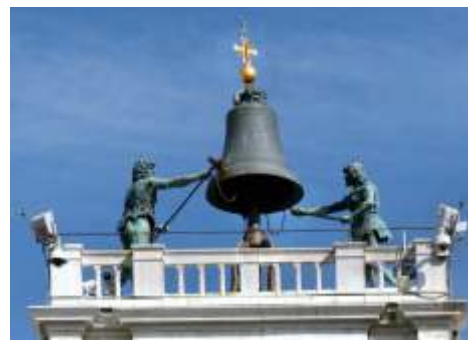
Венеция. Часовая Башня. Гиганты

Будучи на 430 лет моложе своего венецианского предшественника, здание построено не из традиционного кирпича, а из материала XX века – железобетона, и по городской традиции облицовано из-