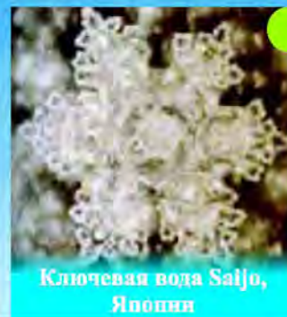
Ключевая вода Saijo, Япония