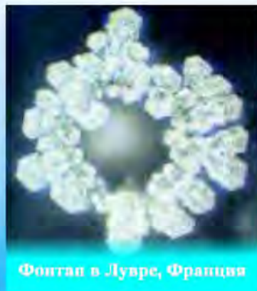
Фонтан в Лувре, Франция