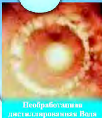
Переработанная дистиллированная Вода