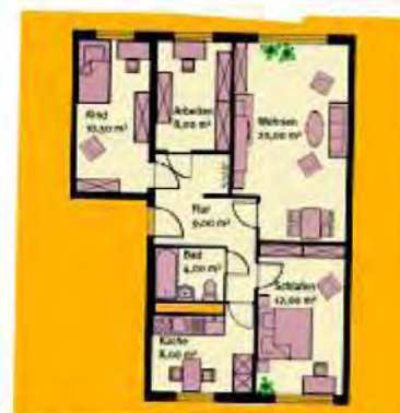
4-х комнатная квартира Witkowskistraße 2 70 м 2 345,00 €