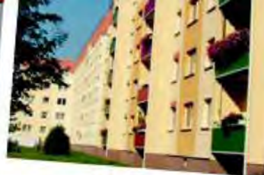
Mockau Например, Otto-Michael-Straße

Новосёлам предоставляются различные дополнительные льготы, например, молодым семьям – 2 года бесплатно подгузники. Подробнее: www.lwb.de !