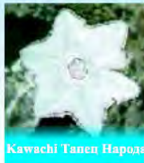
Kawachi Тапец Народа