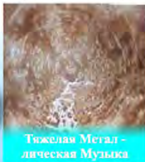
Тяжелая Мегалитическая Музыка