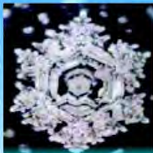
Fujiwara Дамба, после молитвы