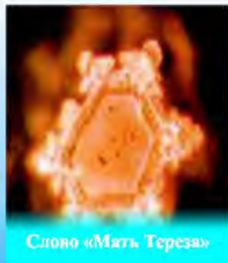
Слово «Мать Тереза»