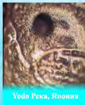
Yodo Река, Япония