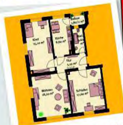
3-х комнатная квартира Stöckelstraße 4 69 м 2 276,00 € *