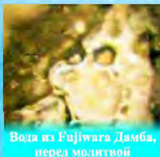
Вода из Fujiwara Дамба, перед молитвой