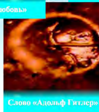
Слово «Адольф Гитлер»

Во всех мировых религиях: христианстве, исламе, иудаизме принято читать перед принятием пищи молитву и освещать еду перед принятием на больших религиозных праздниках. Часто ли мы задумывались - зачем? И откуда в таких непохожих конфессиях появилась уверенность, что так правильно поступать? Отчего нашим предкам было очевидно то, что наука пытается понять только сейчас? Оказывается, частота колебаний молитвы любой конфессии, звучащей на любом языке равна 8 герцам, что соответствует частоте колебаний магнитного поля Земли. Поэтому молитва формирует в воде, входящей в состав абсолютно всех продуктов гармоничную структуру.