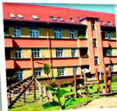
Alt-Schönefeld Например, Stöckelstraße