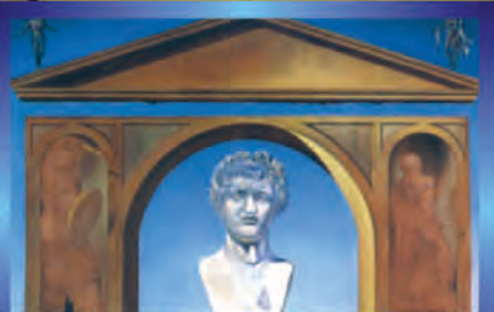
В гостях у Сальвадора Дали