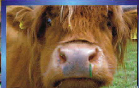
Гороскоп на 2009 год