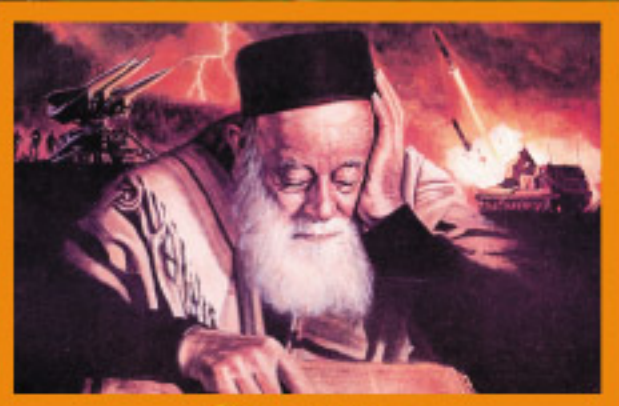
Секреты “Библейского кода”