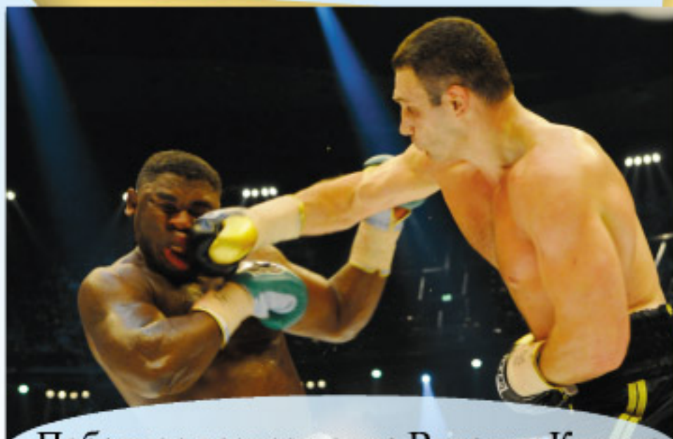
Победное возвращение Виталия Кличко