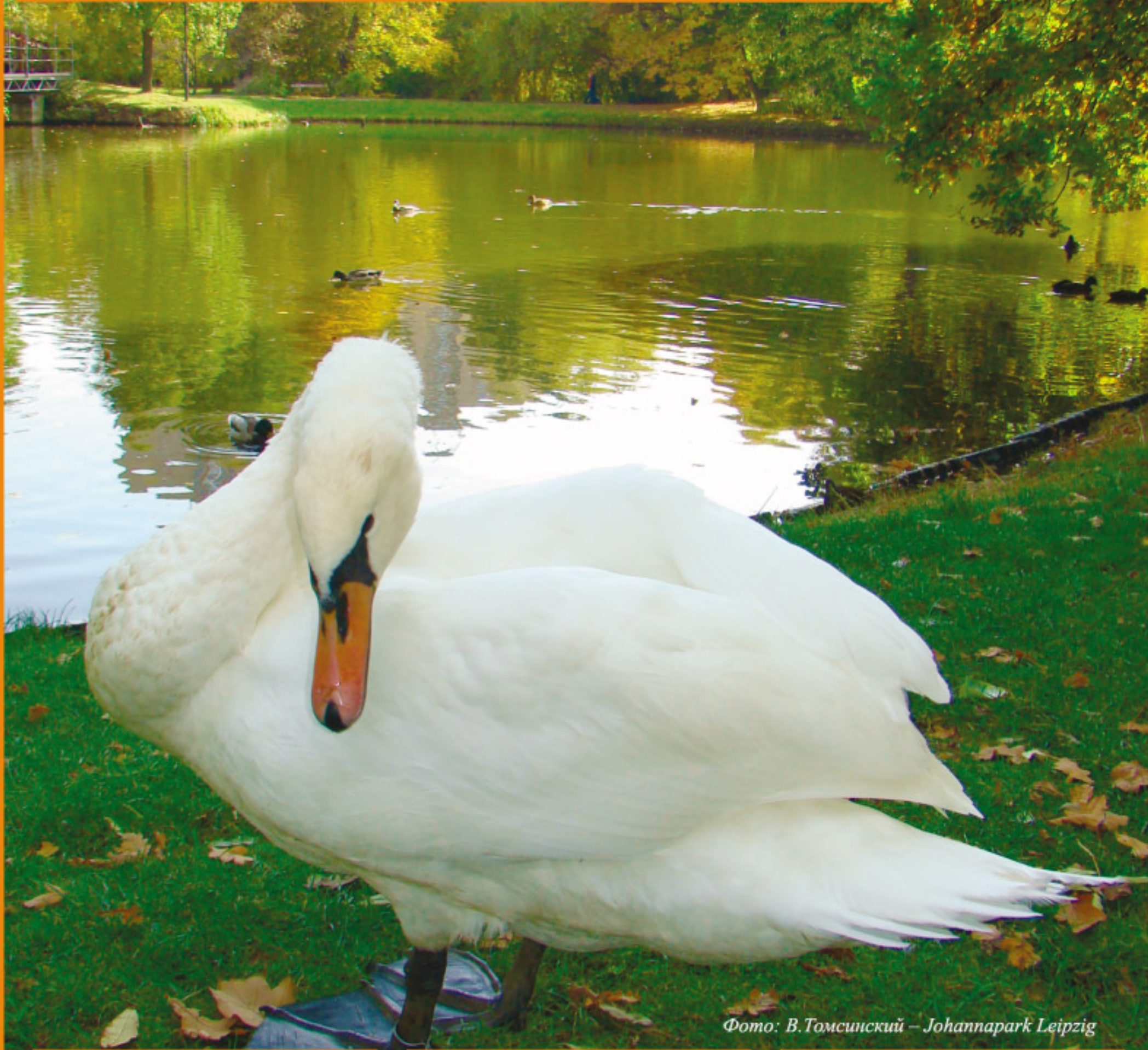
Фото: В.Томсинский – Johannapark Leipzig