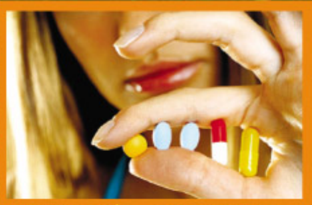
Плацебо - лекарство которого нет