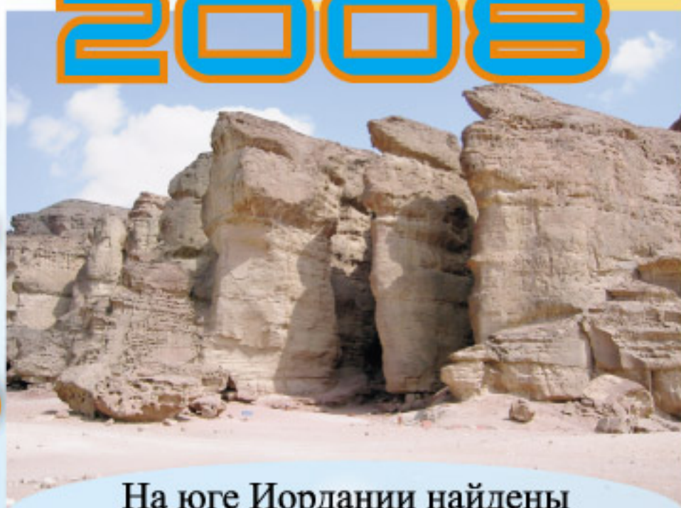
На юге Иордании найдены копи царя Соломона