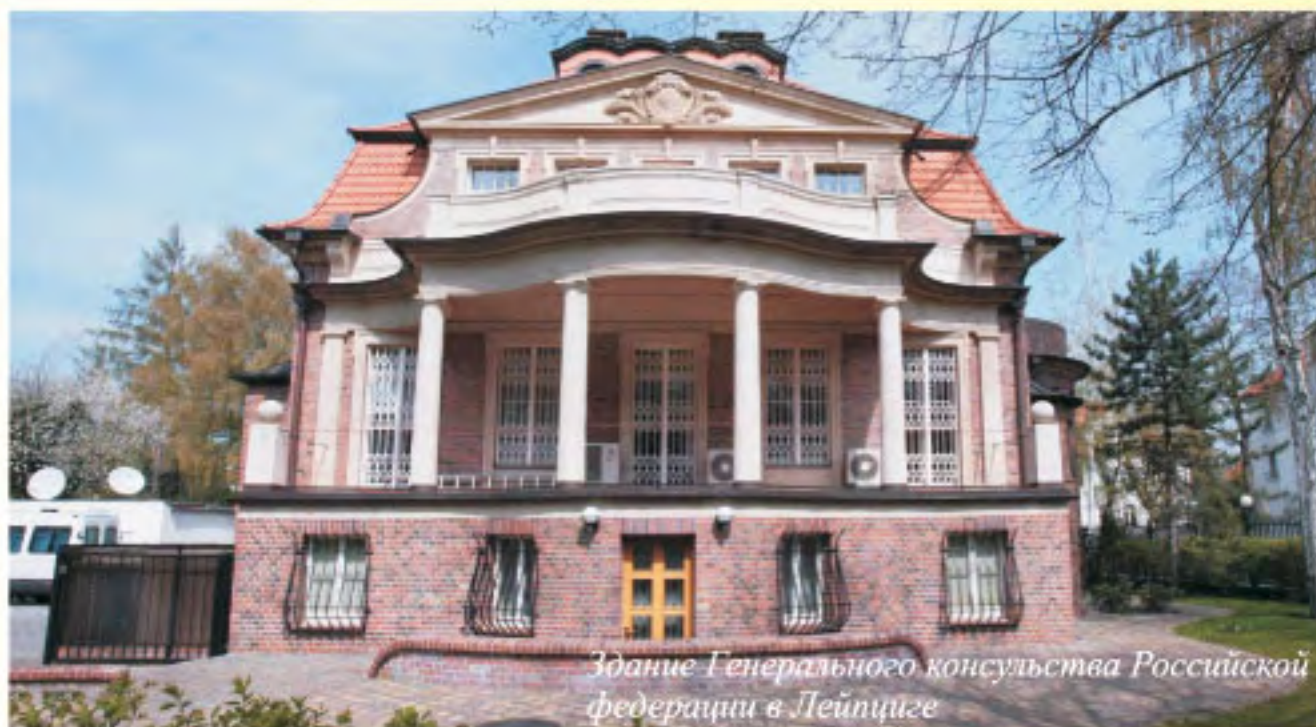
Здание Генерального консульства Российской Федерации в Лейпциге

Орден Горчакова был вручен Генеральному консулу Российской Федерации в Лейпциге Геннадию Голубу.