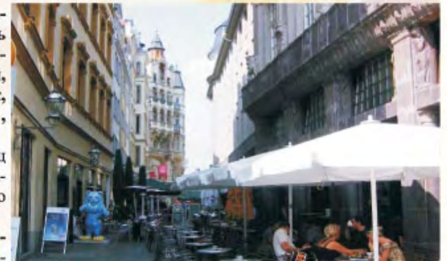
на фото: Barfußgäßchen

Переулок назван так в честь монастыря Францисканцев и монахов францисканского ордена.