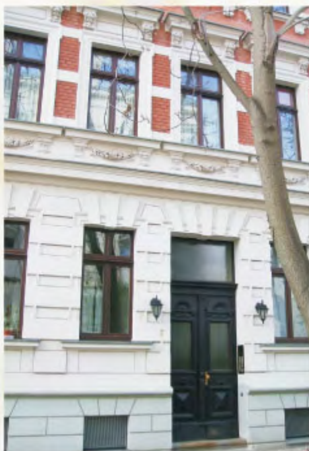
на фото: Czermaks Garten 7 Эрих Кестнер жил здесь будучи студентом

К его столетнему юбилею в Haus des Buches (Доме Книги) проходила выставка, посвящённая жизни писателя в Лейпциге. Исследователи его творчества писателя недоумевают: в Лейпциге есть улица Джека Лондона и Джонатана Свифта, но улицы, носящей имя Эриха Кестнера, нет. Нет и ни одной памятной доски, хотя сохранились дома, в которых он жил. Мы решили разыскать их, чтобы дополнить статью о Кестнере фотографиями. В нескольких шагах от центра, за высотным жилым домом на улочке Czermaks Garten 7, Эрих Кестнер жил будучи бедным студентом. Типичный для застройки рубежа веков пятиэтажный дом, облицованный красным кирпичом, со скромным лепным декором. Делаем несколько снимков, пробуя различный ракурс. Окно нижнего этажа открывается. Молодой человек в пёстрой матерчатой кепочке дружелюбно осведомляется у нас, что необычного мы здесь обнаружили. Рассказываем про Кестнера, жившего в этом доме лет 85 назад.