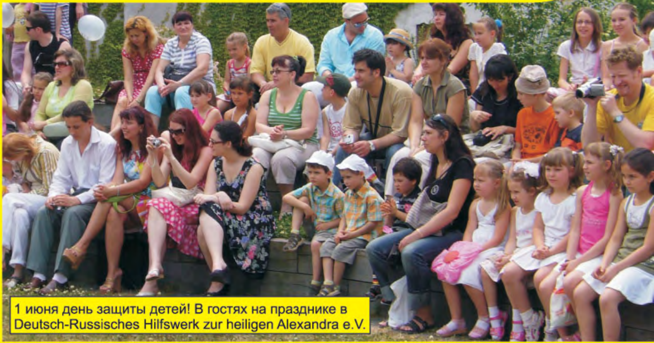
1 июня день защиты детей! В гостях на празднике в Deutsch-Russisches Hilfswerk zur heiligen Alexandra e.V.

Kostenlos * Бесплатный выпуск * Kontakt: lbk-verein@mail.ru Tel.: 0341 / 420 17 82 Fax: 0341 / 420 17 81