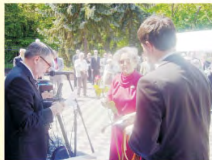
на фото: поздравление ветеранов в помещении Консульства