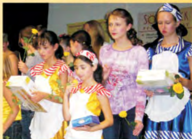
Вручение призов и подарков