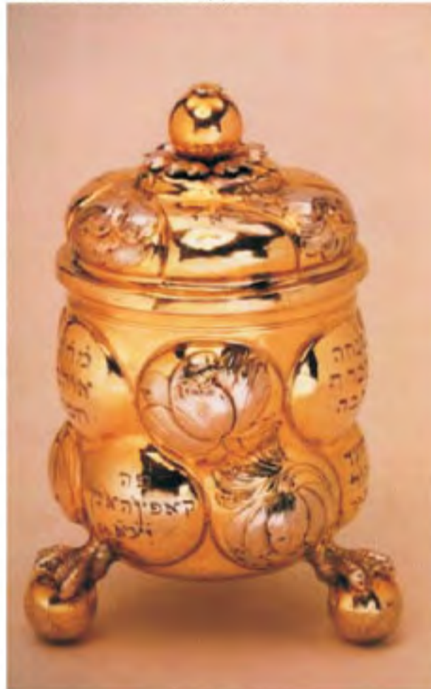
Бокал для кидуша. Германия, XVIII век.