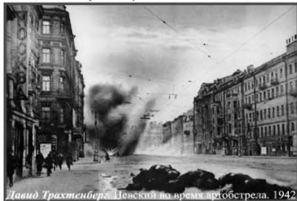
Давид Трахтенберг. Невский во время артобстрела. 1942

Сентябрь и начало октября 1941 г. знаменовались грозными событиями. Немцы подошли к самому Ленинграду. Город был затемнен. Все меньше и меньше оставалось знакомых и друзей, многие были вынуждены эвакуироваться со своими учреждениями. В голове пронеслись мысли: «Неужели враг возьмет Ленинград? Какие испытания, какая борьба предстоит оставшимся!»