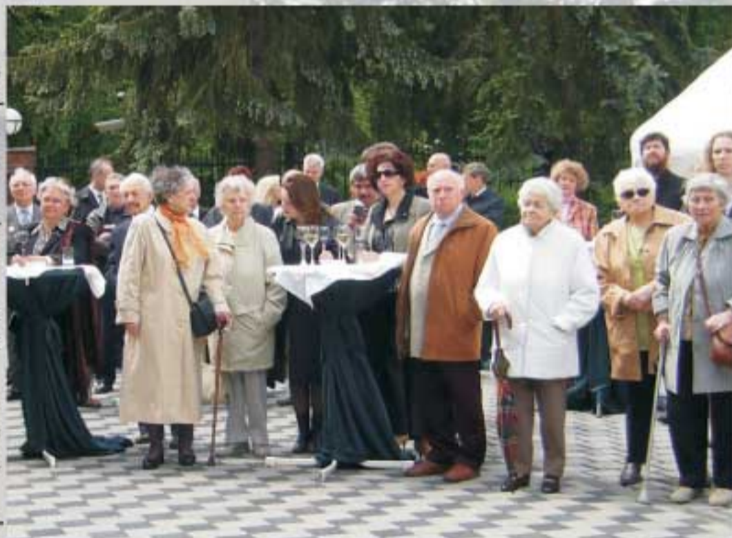
На фото: На приеме в ГК Ветераны Великой Отечественной войны

Сердечно поздравляем наших дорогих ветеранов с юбилеем Победы. Проходят годы, но ваш подвиг по-прежнему живет в сердцах благодарных потомков. В эти дни мы хотим пожелать вам крепкого здоровья, пусть счастье и радость никогда не покидают ваши семьи!