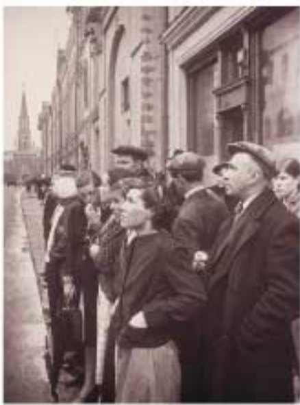
22 июня 1941 года. Объявление о начале Великой Отечественной войны. Москва, улица 25-го Октября.