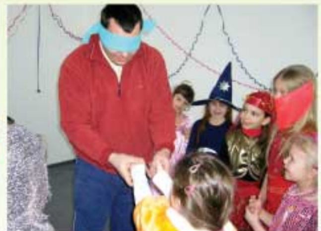
На сказочном балу третьего марта